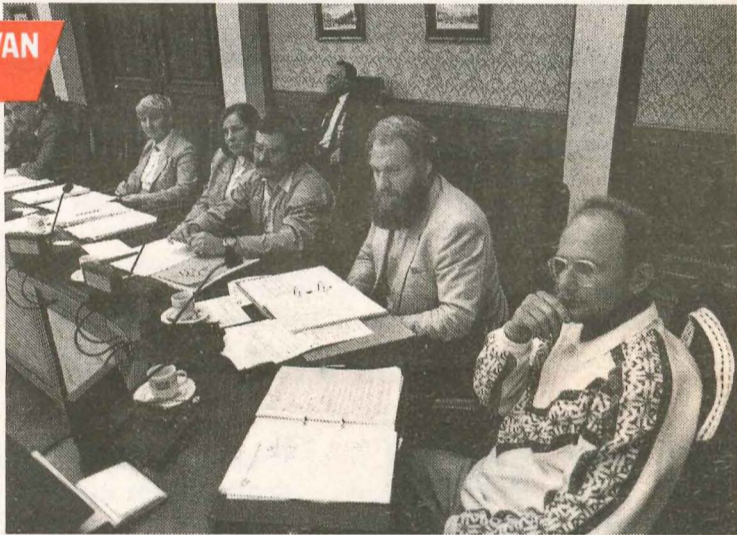
● De vijfkoppige SP-fractie in de gemeenteraad van Vlaardingen.

De SP groeit snel. Met 15.000 leden is ze de vijfde partij van het land. In 1986 veroverde de SP in 23 plaatsen 42 raadszetels. In 1987 haalde de partij de eerste provinciale zetel. Volgend jaar doet de SP in bijna honderd steden mee aan de gemeenteraadsverkiezingen.