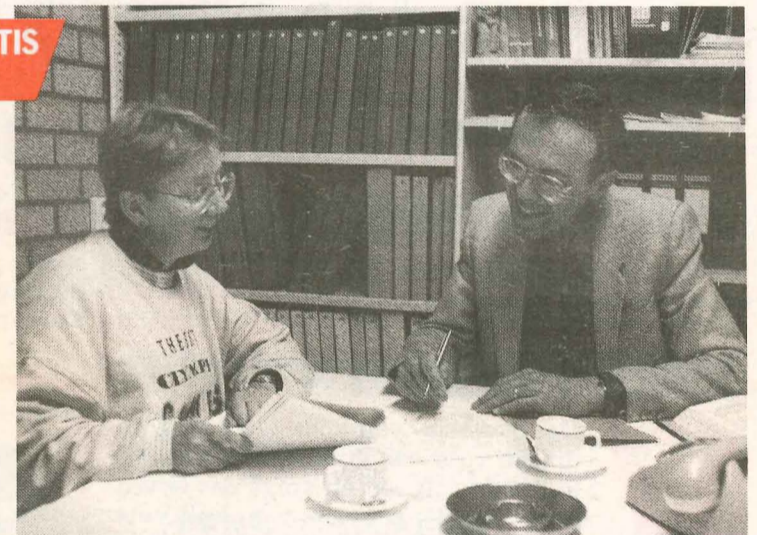
● Met belastingproblemen op een van de vele spreekuren van de SP.

Duizenden mensen vinden jaarlijks hun weg naar de gratis spreekuren van de SP Hulp- en Informatiedienst. Problemen met de baas of de verhuurder, de gemeente of de bedrijfsvereniging, de belasting of de winkel — bij de SP worden ze aangepakt.