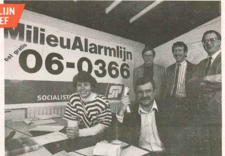
● Het MilieuAlarmteam van de SP: professioneel en deskundig

De MilieuAlarmlijn van de SP geeft een unieke kans aan iedereen die dingen ziet die het milieu niet kan verdragen, alarm te slaan: op het gratis nummer 06-0366. Met een professioneel MilieuAlarmteam en honderden enthousiaste vrijwilligers kan alert en doeltreffend op die milieumeldingen gereageerd worden.