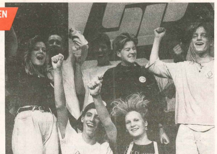
● Enthousiaste jongeren op een SP-manifestatie

Wie de jeugd heeft, heeft de toekomst. Maar de Nederlandse jeugd krijgt steeds minder kansen. Van de school — in de WW. Lagere studiebeurzen en tot je 27e een mager jeugdloon. De SP-Jongerenorganisatie brengt jonge mensen bij elkaar om samen tegen die verslechtingen te vechten.