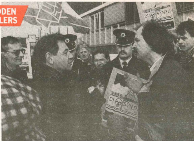
● In actie voor de poorten van chemiegigant Akzo/Diosynth voor schone lucht.

Schaamteloos verpesten de ondernemers ons milieu. En politici geven gewone mensen de schuld, en de rekening. De SP bindt de strijd daartegen aan. Ze heeft een naam verworven als onthuller van milieuschandalen. De SP ontleent haar kracht en kennis op dit punt aan haar samenwerking met arbeiders en buurtbewoners.