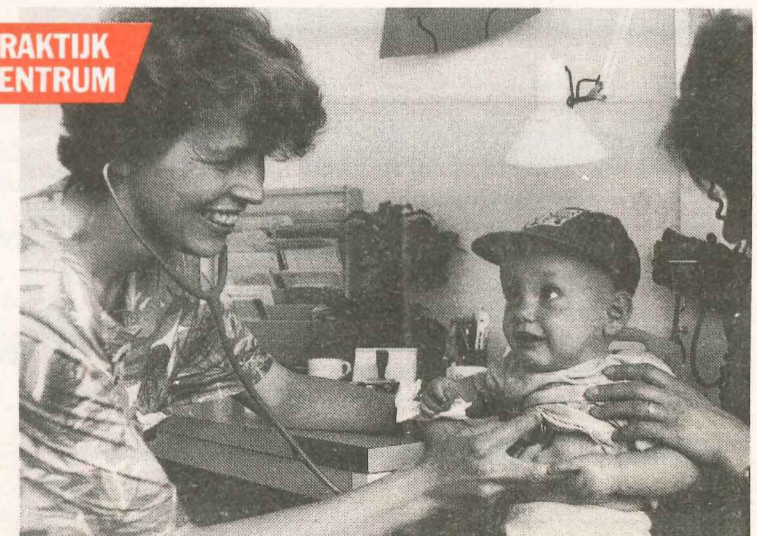
● Op het spreekuur bij Ons Medies Centrum in Oss.

De gezondheidszorg wordt jaar na jaar verder afgebroken. De SP geeft tegengas, met haar campagne 'Hé, van onze gezondheidszorg blijf je af!' En in eigen medische centra, met artsen in loondienst en veel aandacht voor de patiënt, laat de SP zien dat het anders kan.