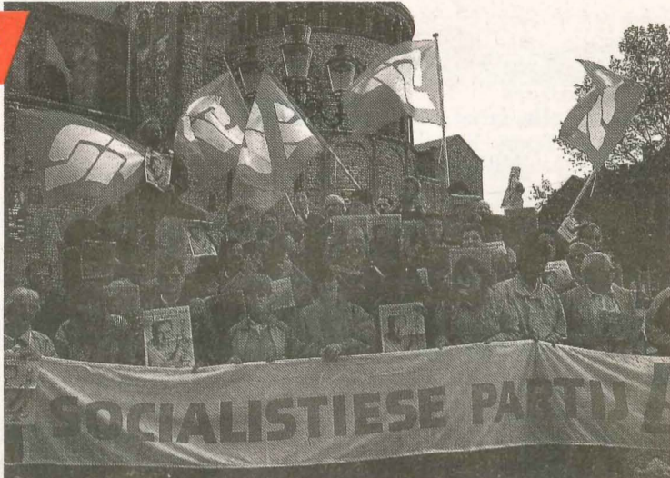
● SP'ers op het Vrijthof in Maastricht: start van de landelijke Handvest 2000-kampagne.

Met Handvest 2000 geeft de SP een duidelijke kijk op de maatschappij van morgen. Maar de wereld verandert niet door er alleen maar over te praten. Daarom steken SP'ers in het hele land de handen uit de mouwen. Op deze pagina vindt u een aantal voorbeelden.