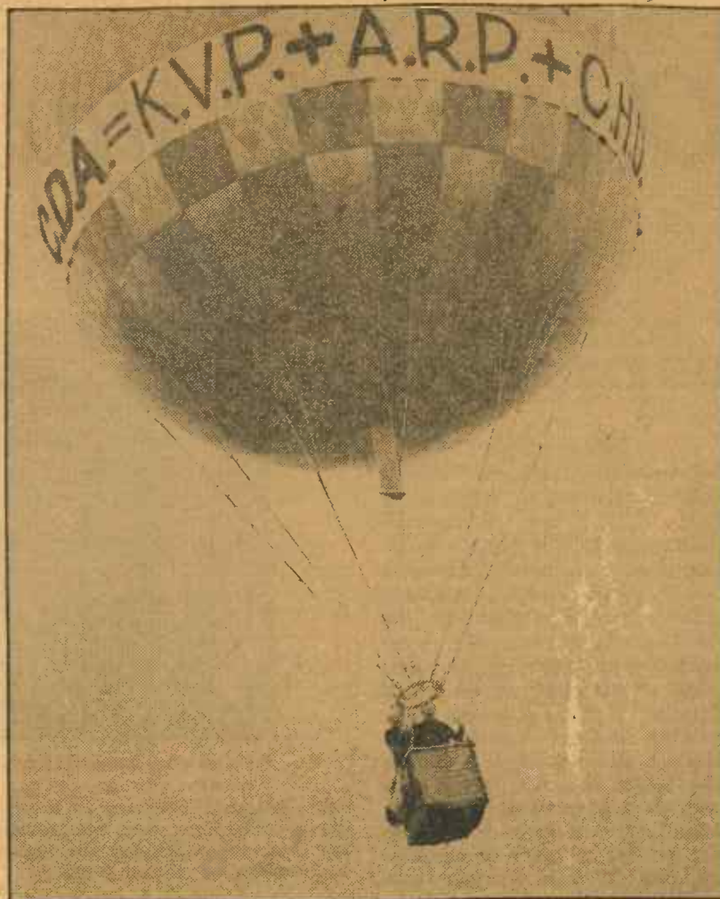
Deze luchtballon werd als propagandamiddel in de jongste stembus-strijd gebruikt door het CDA

□ Kandidaten voor de Tweede Kamer kunnen worden gesteld door het Bestuur en door de afdelingen. □ De plaatselijke afdelingen brengen hun stem uit op haar toegezonden stembiljetten aan de hand van de eveneens toegezonden alfabetische groslijst. Voor het opmaken van de uitslag wordt het puntenstelsel toegepast, met inachtneming van de plaats die iedere kandidaat