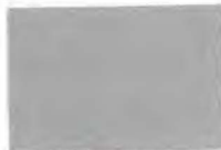
Caspar Bielok Alg. Bestuurslid