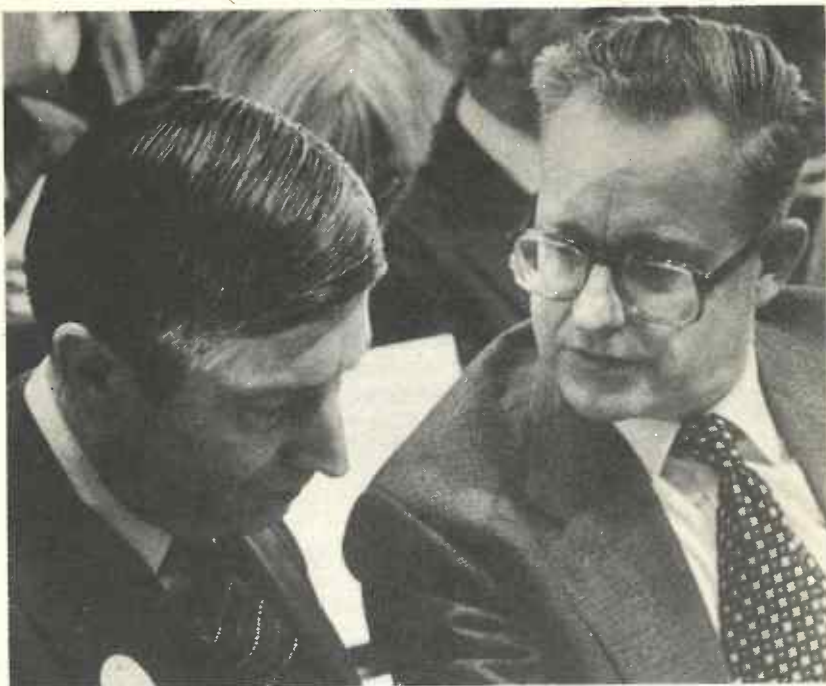
Minister-president Van Agt (links) overlegt met minister Scholten van Defensie.