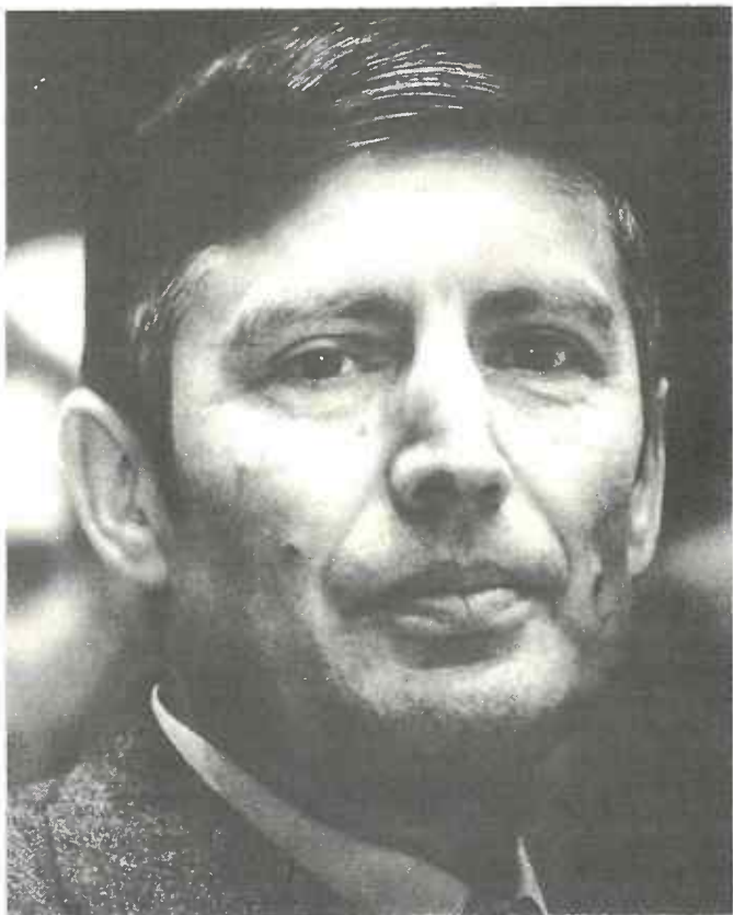
Mr. A.A.M. van Agt, lijsttrekker CDA