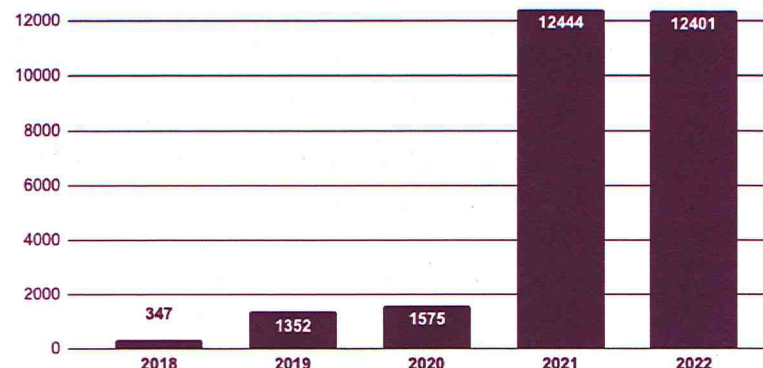
Ontwikkeling ledenaantal (per 31 december) van Volt Nederland