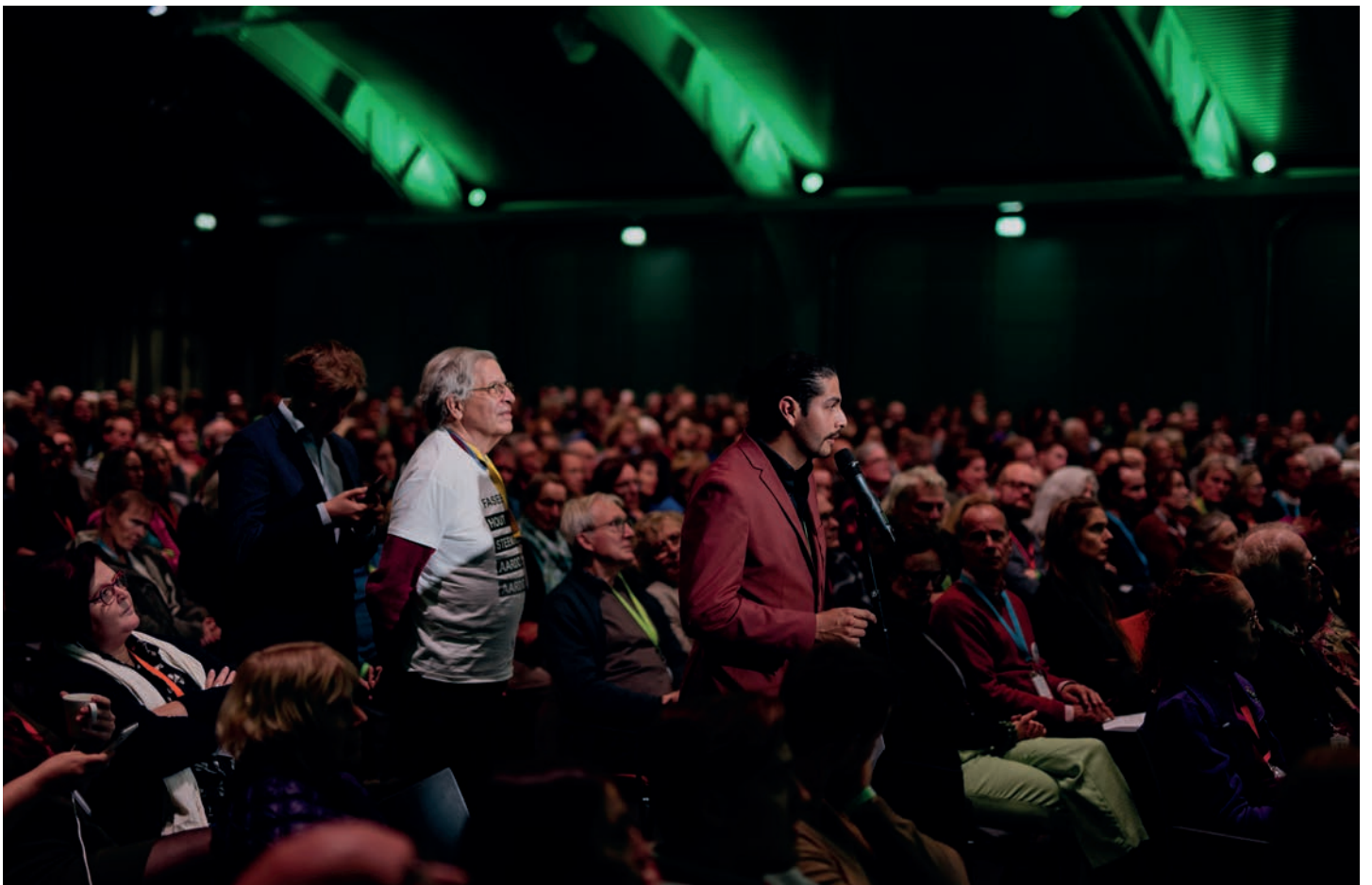
Leden kunnen stemmen en inspreken tijdens congressen