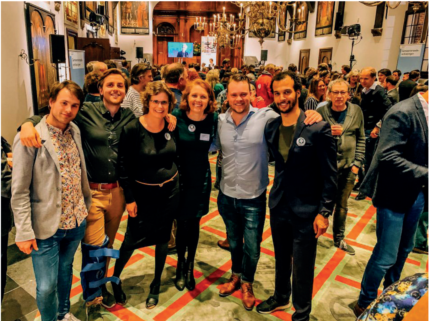
PvdD-fracties Almere en Haarlem vieren de verkiezingsuitslag