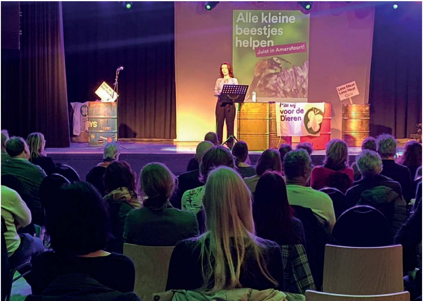
Lezingen door partijleider Esther Ouwehand