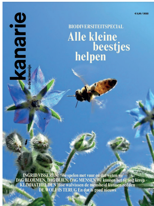
Speciale editie magazine Kanarie in de Kolenmijn