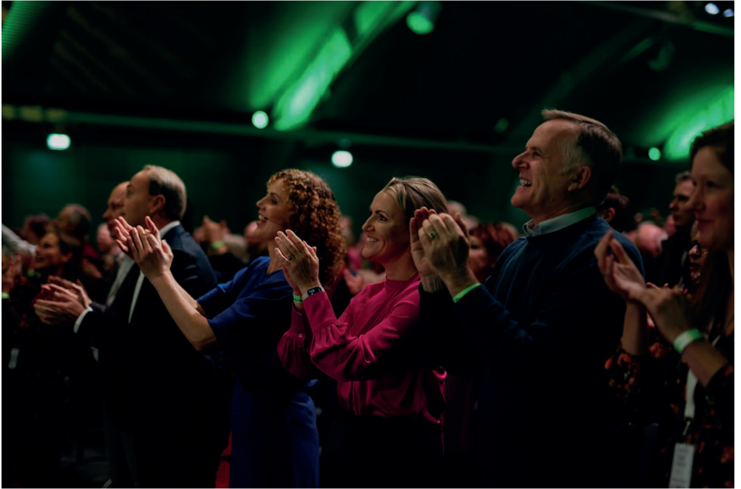
V.l.n.r. Tweede Kamerleden Christine Teunissen, Leonie Vestering, Lammert van Raan en Eva van Esch