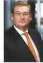
Ard van der Steur