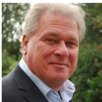
Michiel Krom Communicatie en Campagne