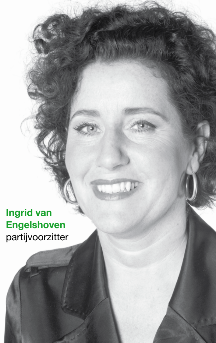
Ingrid van Engelshoven partijvoorzitter

Daarnaast is er natuurlijk ook weer voldoende gelegenheid om mensen te ontmoeten en te spreken. Er zijn diverse stands waar u terecht kunt met uw vragen aan diverse thema-afdelingen of de fracties van het Europees Parlement en de Tweede Kamer. Als prachtige afsluiter zal de borrel dit keer tot maar liefst half negen in de avond duren. Er is dus volop gelegenheid om na het volle dagprogramma met elkaar te borrelen en na te praten. Ik wens u een inhoudelijke en onderhoudende dag toe!