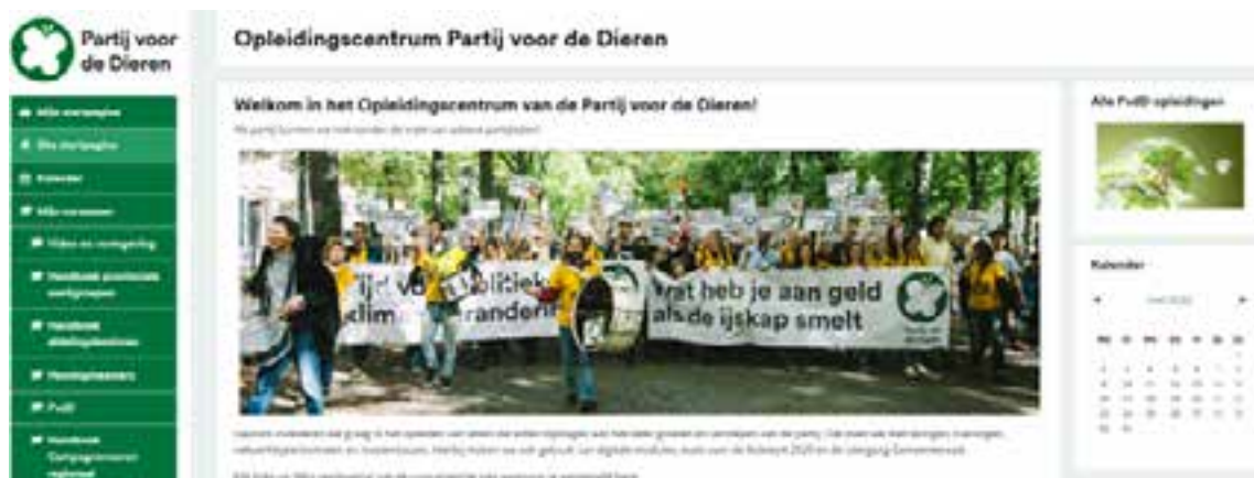
Startpagina online leeromgeving

Als partij kunnen we niet zonder de inzet van actieve partijleden! Daarom investeren we volop in het opleiden van leden die willen bijdragen aan het laten ontwikkelen en groeien van de partij. Dit jaar waren veel trainingen gericht op verkiezingen, zowel voor de Tweede Kamerverkiezingen van 2021, als voor de gemeenteraadsverkiezingen van 2022 en de verkiezingen voor Provinciale Staten en waterschappen in 2023. Deze opleidingen worden georganiseerd vanuit het partijbureau, maar zouden niet mogelijk zijn zonder de enorme inzet van afdelingsbestuurders, provinciale werkgroepleden, vele volksvertegenwoordigers en een aantal fractiemedewerkers!