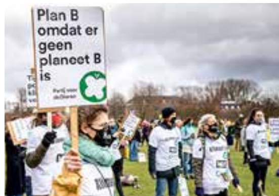
Werkgroep Amsterdam in actie tijdens het Klimaatalarm