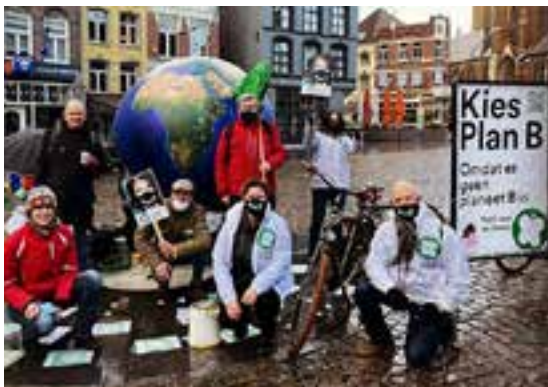
Provinciale werkgroep Limburg voert campagne voor de Tweede Kamerverkiezingen

Er zijn in totaal acht afdelingen met een gekozen afdelingsbestuur: Drenthe, Friesland, Gelderland, Groningen, Noord-Brabant, Noord-Holland, Utrecht en Zuid-Holland. Onder deze afdelingen vallen meerdere lokale werkgroepen. In de vier provincies zonder afdeling is een provinciale werkgroep actief: Flevoland, Limburg, Overijssel en Zeeland.