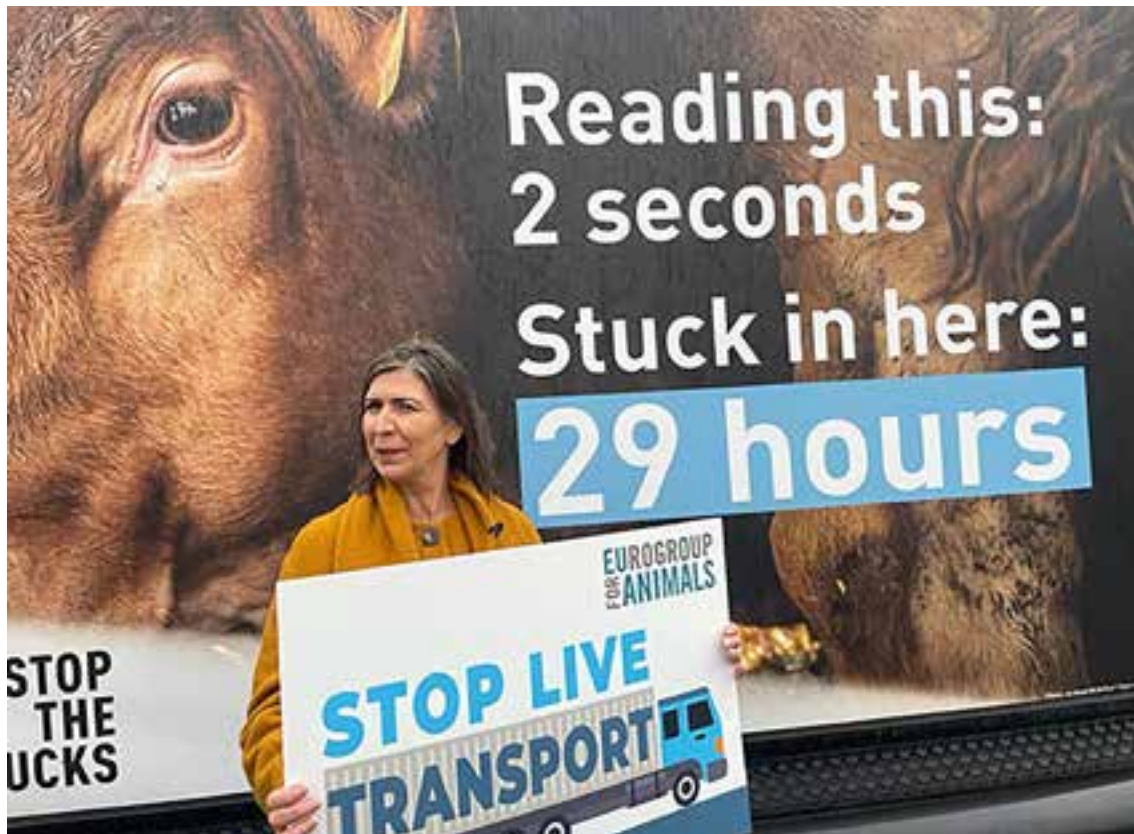
Europarlementariër Anja Hazekamp voert actie tegen lange diertransporten

Het Europees Parlement is voor extra maatregelen om de natuur te beschermen en te herstellen. Deze voorstellen staan in een rapport over biodiversiteit, waarin benadrukt wordt dat ontbossing, klimaatverandering, grootschalige landbouw en handel in wilde dieren een bedreiging vormen, ook voor de mens. PvdD-Europarlementariër Anja Hazekamp schreef hieraan mee.