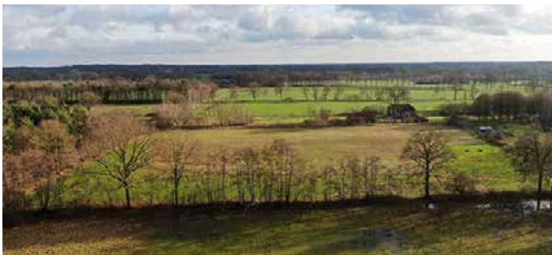
Het gebied in Nede

Ook kwamen we dit jaar opnieuw in actie met een woudfunding. In het Gelderse Neede en Limburgse Maasbracht hebben we voormalige landbouwgrond vrijgekocht om hier nieuwe natuur te creëren. Men kon één of meer vierkante meters natuur adopteren met als dank een prachtig natuurcertificaat. Alle stukjes natuur waren al snel geadopteerd! We zijn op 23 februari gestart en op 15 april was het uitverkocht.