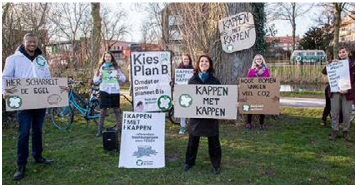
In Leiden voert de werkgroep actie tegen de kap van bomen in het Roomburgerpark