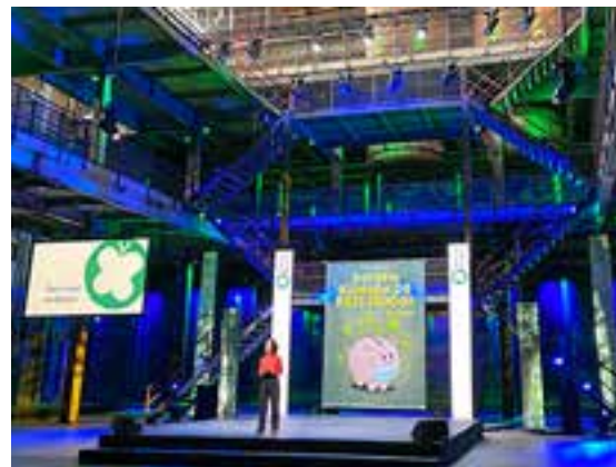
Esther Ouwehand geeft een speech in SugarCity