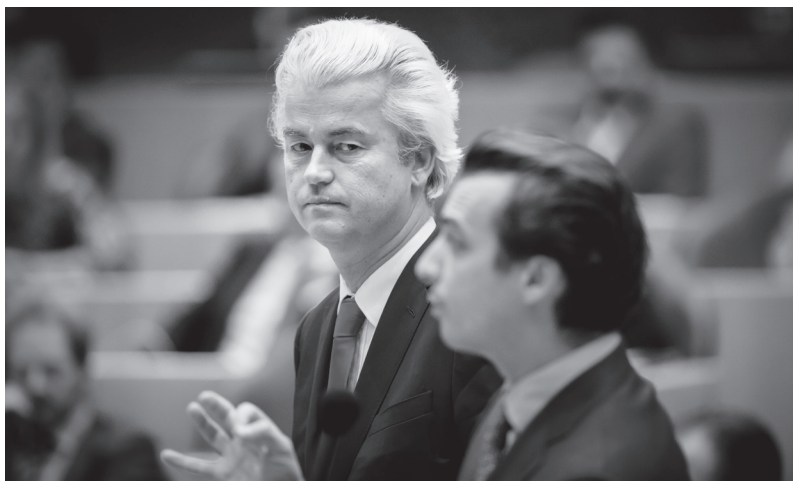
Geert Wilders en Thierry Baudet van Forum voor Democratie tijdens het Kamerdebat over het vertrek van minister van Buitenlandse Zaken Halbe Zijlstra (vvd) op 13 februari 2018.

Het is zeer goed mogelijk dat de dramatische nederlagen in 2019 de doodsteek zullen blijken te zijn voor de pvv en dat dit boek als een soort grafrede dient. Aan de andere kant is de pvv al verschillende malen vanuit een schijnbaar geslagen positie teruggekomen. In 2008 maakte de beweging Trots op Nederland van de gewezen vvd'er Rita Verdonk een enorme opmars in de peilingen, die grotendeels ten koste leek te gaan van de pvv. Twee jaar en vele interne conflicten later haalde Trots op Nederland zelfs niet eens de kiesdrempel en won de pvv 24 zetels, haar beste resultaat tot nu toe. Ook in 2012 leek de partij op haar retour, nadat Wilders zijn besluit om het door hem gedoogde eerste kabinet-Rutte te laten vallen moest bekopen met gevoelig zetelverlies. In 2014 zorgde zijn beruchte 'minder Marokkanen-toespraak' voor een verdere uittocht van pvv-activisten. In 2016 was de partij echter weer helemaal terug en stond zij in sommige peilingen zelfs op meer dan veertig zetels.