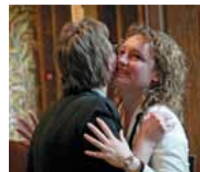
Renske Leijten krijgt de felicitaties nadat een wet is aangenomen die een einde maakt aan het aanbesteden van thuiszorg door gemeenten.

Kijk hoe Renske zich verzet tegen de uitverkoop van onze zorg: www.sp.nl/zorg