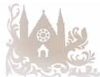
6 FABELTJES VAN HET GEVALLEN KABINET MAAR NIET IEDEREEN GELOOFT IN SPROOKJES Pagina 6