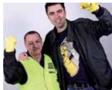
ACTIE LOONT HOE DE VAKBOND VUUR GAF AAN DE SCHOONMAKERS Pagina 9