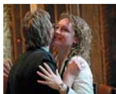
AANHOUDER WINT SP-WET TEGEN UITBUITING IN DE THUISZORG Pagina 10