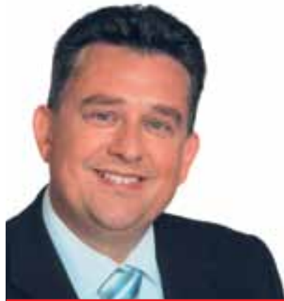
EMILE ROEMER, FRACTIEVOORZITTER SP

Het land is in crisis. Moeten we dan wel verkiezingen houden? Ik zie de grote problemen waar we voor staan. De haperende economie, die maar niet op gang wil komen. Veel zorgen maak ik me ook om het gebrek aan vertrouwen. In banken en financiële instellingen, in de mensen die ons geld beheren. Het gebrek aan vertrouwen in de bestuurders van woningcorporaties, onderwijs- en zorginstellingen. En vooral het gebrek aan vertrouwen in de politiek, dat die er is voor de belangen van gewone mensen.