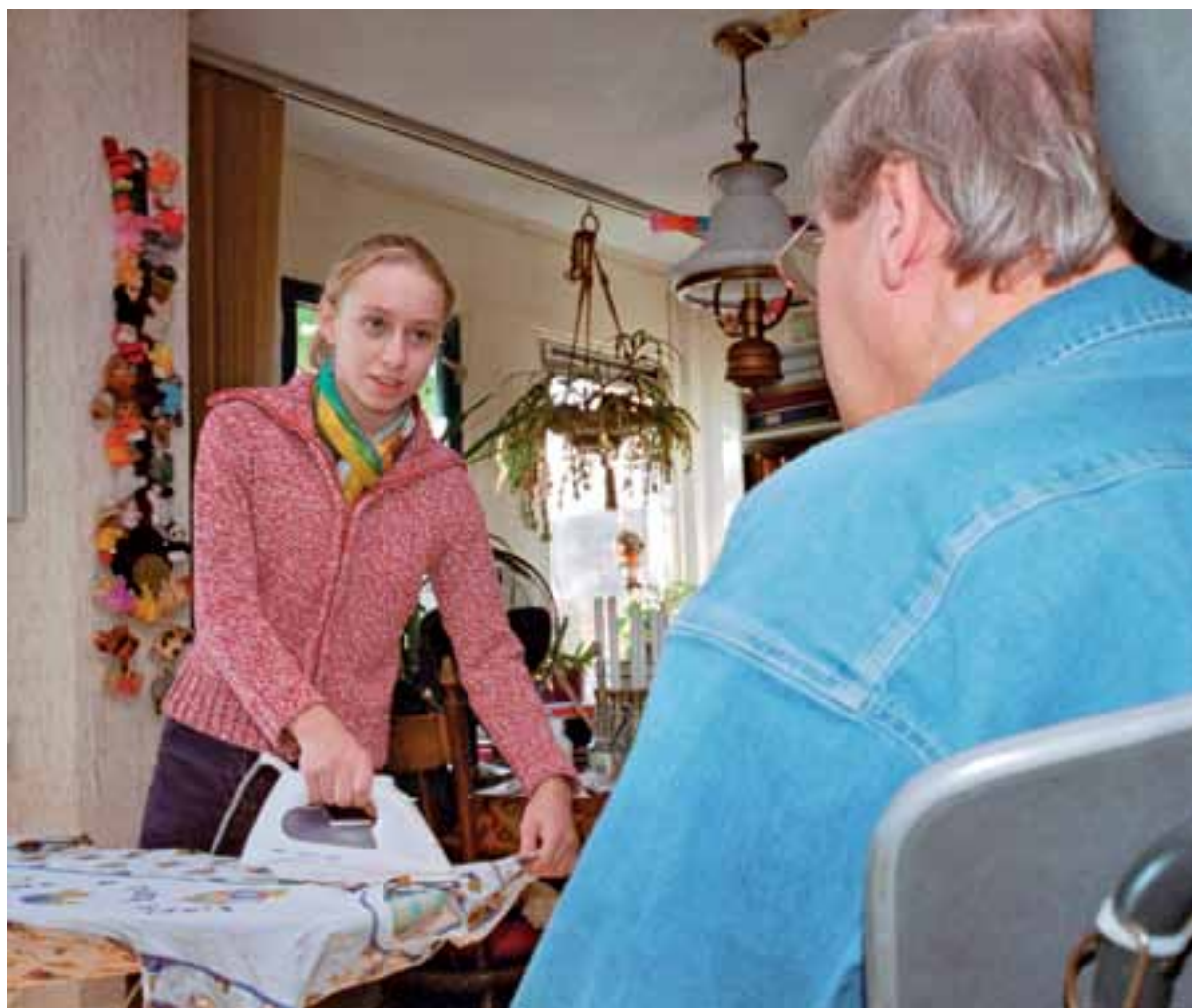
Het signaleren en communiceren is net zo belangrijk als het huishoudelijk werk in de thuiszorg. (De personen op de foto komen niet in dit verhaal voor.)