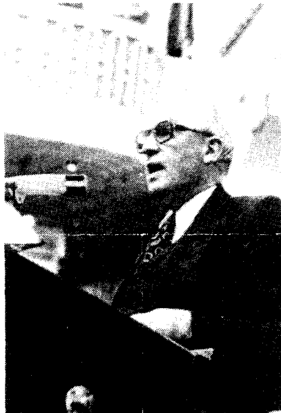
„Onze lijsttrekker bij de komende Europese verkiezingen“.

In Genesis 10 en 11 is sprake van de verdeling der aarde in landen en volken. Ieder land heeft eigen regering, eigen grenzen, eigen bevolking, eigen klimaat en eigen bodemschatten. Door verschil in klimaat, bodemgesteldheid en grondstoffen ontstond veelal een levendig handelsverkeer. De handelskaravanen in de grijze oudheid zijn uit gewijde en andere geschriften overbekend.