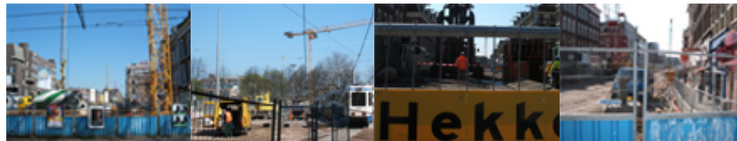
2km overzicht van km lang bouwput in Amsterdam a.g.v. Noordzuidlijn Vijzelstraat, Weteringsgracht, Ferdinand Bolstraat