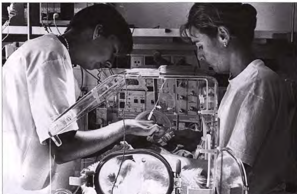
Tweeling, geboren na 26 weken, 6 ons per kindje

niet behoeven te weten. Indien prenatale diagnostiek wordt aan gevraagd kan dat geen enkele verplichting tot een mogelijke abortus inhouden.