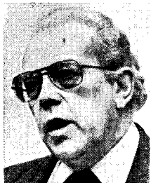
prof. dr. W. Albeda is minister van Sociale Zaken; daarvóór was hij rector van de Stichting Bedrijfskunde te Delft.

waarden? Ik denk dat het onvermijdelijk is dat wij zoeken naar politieke maatregelen, die de aanvaardbaarheid van het wat minder aantrekkelijke sociaal-economische en financiële beleid kunnen vergroten. De gedachten die destijds zijn ontwikkeld in het CDA-rapport 'Gespreide Verantwoordelijkheid' over de economische orde, die behoorlijk wat aandacht hebben gekregen in het ontwerp-verkiezingsprogram, zullen de komende jaren politiek vertaald moeten worden in maatregelen die inderdaad de verantwoordelijkheden spreiden. Niet alleen wat betreft het loonbeleid, dus het decentraliseren van het loonoverleg naar lagere niveaus (lieftst in de onderneming of althans zo dicht mogelijk bij de onderneming), maar ik denk ook aan het spreiden van verantwoordelijkheden met betrekking tot het economisch beleid, dus de zeggenschap over investeringen, zeker als het gaat over de zeggenschap over het geld dat beschikbaar komt als gevolg van inkomensmatiging.