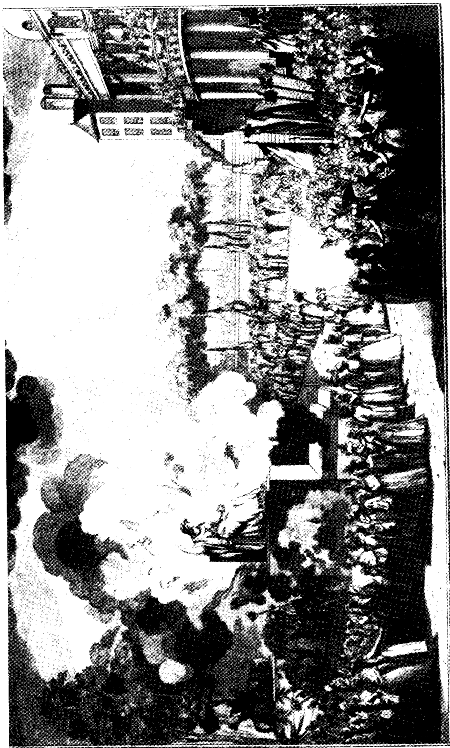
PAVILLON DU JARDIN NATIONAL ET DES DÉCORATIONS LE JOUR DE LA FÊTE CÉLÉBRÉE EN L'HONNEUR DE L'ÊTRE SUPRÊME. (Maison Descartes) D'APRÈS UN DESSIN DE MONFLEURY.

Viering ter ere van het Opperwezen. (foto Maison Descartes)