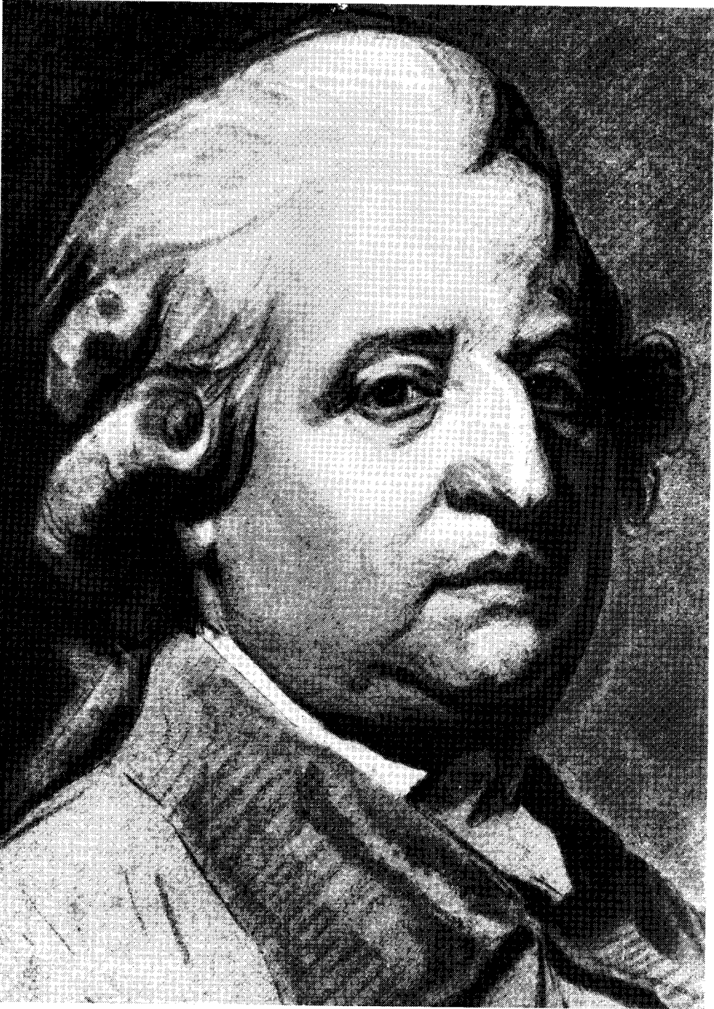
Koning Lodewijk XVI, koning via 'droit divin'.