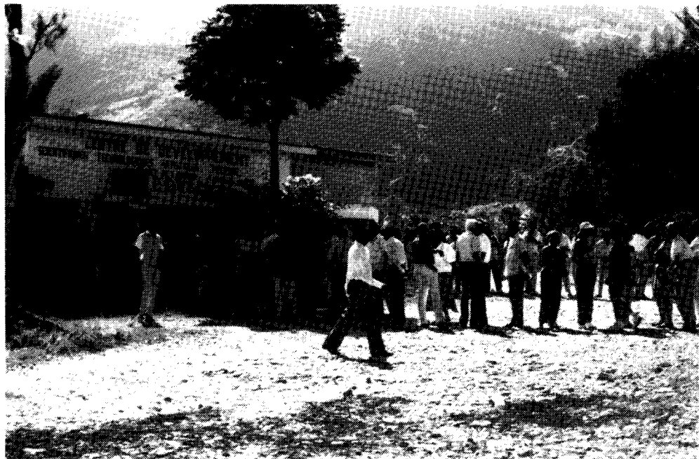
'Lange rijen voor het stemlokaal. Vaak uren geduldig wachten.'

enkele voorbeelden uit de lange lijsten, die de mensenrechtenorganisaties bijhouden.