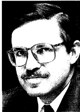
Prof. mr. dr. E.M.H. Hirsch Ballin

of daaraan aan schade had toegebracht. In het christen-democratische gedachtegoed gaat het echter om meer dan dit enkele afrekenen. Deze visie op de samenleving is bepalend voor een wel omgrensde taak van de overheid: een taak die het weefsel van de samenleving ondersteunt, waar nodig aanvult, maar niet wil vervangen. In dit opzicht laat de gedachte van de verantwoordelijke samenleving nog eens zien dat men een consistente visie op de taak van de overheid alleen kan ontwikkelen vanuit een visie op de samenleving. De beoordeling van het publiek domein veronderstelt een 'sociale leer'. Het concept van de verantwoordelijke samenleving gaf - op basis hiervan - ook aan hoe de overheid haar taak