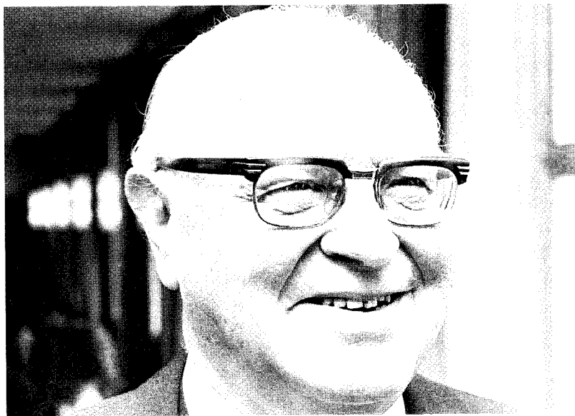
Romme, de "professor", was de verpersoonlijking van de KVP.

Niet alleen als uitvloeisel van haar karakter als 'integratiepartij', maar ook omdat haar politieke overtuiging erom vroeg, onderhield de KVP nauwe contacten met verwante maatschappelijke organisaties. Het bij elkaar brengen van de verschillende belangen in de samenleving, in het licht van de politieke beginselen, achtten de katholieke politici als hoofdopdracht. Die taak was trouwens krachtens een bisschoppelijk ge-