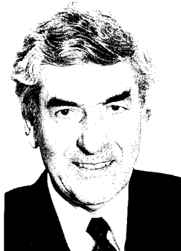
Dr. R.F.M. Lubbers

Zeker christen-democraten doen dat in de overtuiging dat Hij die aan het ein-