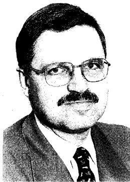
Prof. dr. E.M.H. Hirsch Ballin

W at men kan lezen in een tijdschrift als dat nu voor u ligt, is uitermate beperkt, vergeleken met wat er allemaal te lezen valt op de pagina's die gebruikers van het Internet kunnen opvragen. Op het Internet is onafzienbaar veel informatie beschikbaar, maar we moeten ons wel realiseren dat mensen niet eindeloos veel informatie in zich op kunnen nemen. Het wezenlijke verschil tussen het Internet enerzijds en kranten, tijdschriften en radio- of televisieprogramma's anderzijds is dus dat het Internet geen selecterende redactie heeft, en de voorheen bekende media noodzakelijkerwijs altijd wel. Is dat een voordeel van het Internet? Als we de aandacht richten op landen waar censuur selecteert is het antwoord stellig ja. In een samenleving als de onze ligt het antwoord minder voor de hand. Het zijn vooral mensen die een kritische, vorsende instelling hebben die met het Internet zijn gebaat. Er zijn evenwel ook mensen