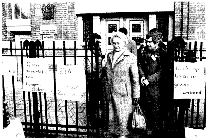
Marga Klompé nadat zij in de brievenbus van de Zuid-Afrikaanse ambassade aan de Wassenaarsweg een petitie heeft gedeponerd. De petitie betuigt solidariteit met de hongerstakende zwarte vrouwen in de Kaapstadse kathedraal.

gieler. Een man als Harry van Doorn, die ooit voorzitter van de KVP was geweest, koos voor de Politieke Partij Radicale, voor een progressieve volkspartij. Hij brak met de KVP. Ook dat was een vorm van emancipatie: de deur achter je dicht trekken. Marga deed dat niet. Zij bleef trouw aan de Katholieke Volkspartij. Intussen halveerde de ahang van de KVP in de tien jaar tussen 1963 en 1972. Voor Marga Klompé was de authenticiteit van de eigen boodschap echter belangrijker dan de grootte van de partij. Misschien heeft ze ook wel gedacht dat de partij de problemen wel weer te boven zou komen, omdat ze de achteruitgang als een tijdelijk fenomeen beschouwde, dat mede te wijten was aan het feit dat de partij in de loop van de jaren te regentek was geworden. Zij was zelfs zo katholiek dat zij de totstandkoming van het CDA niet zag zitten. Katholieke instituties waren nog steeds haar referentiekader. Samenwer-