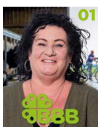
Caroline van der Plas