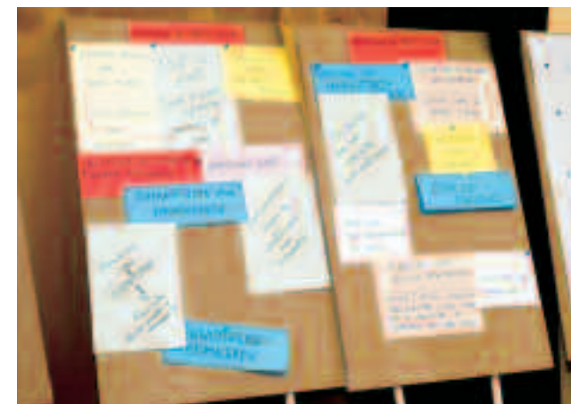
Een greep uit de reacties

Conferentiedeelnemers konden een formulier invullen met hun commentaren, opmerkingen en aanbevelingen, of een e-mail sturen naar de Stichting Beroepseer.