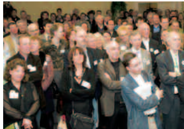
In de aula van het Mondriaan College