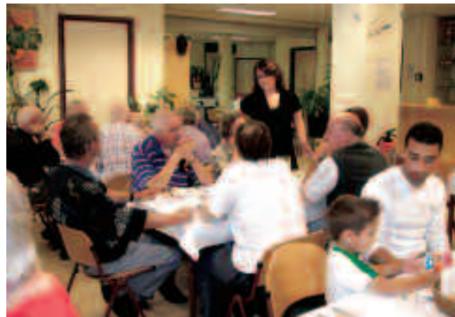
Het eerste, in 2004 geopende, VanHarte Resto aan het Joncbloetplein in Den Haag

Na Artsen zonder Grenzen werkte ik bij UNICEF en ook een tijd als vrijwilliger bij de Boodschappen- en Begeleidingsdienst in Den Haag. Ik ging naar mensen om met hen boodschappen te doen, naar een supermarkt bijvoorbeeld. Toen ontdekte ik dat