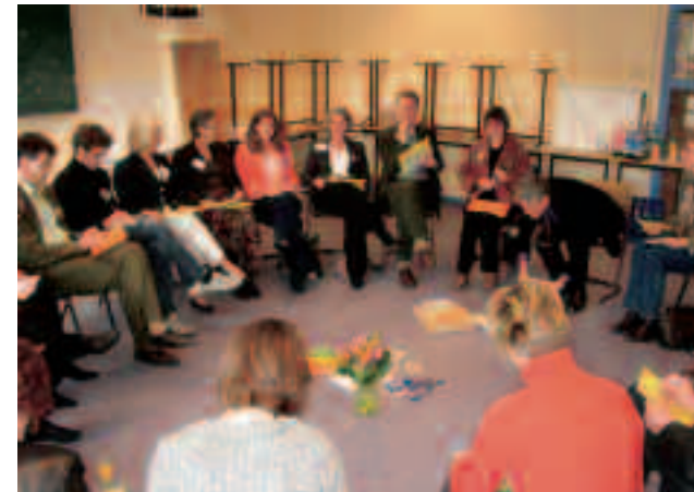
De sessie “Wat beheerst ons? Wat bezielt ons?” o.l.v. Willem Beekman

Een voordracht over “De Straalmeesters” door bioloog en schrijver Willem Beekman ging over de manier waarop meesterschap bereikt wordt aan de hand van vier voorbeelden. Van de stotterende Demosthenes uit het oude Griekenland die een welbespraakt redenaar werd tot de eeuwig schijnende zon, de grootste grootmeester die we kennen en die straalt vanuit zijn eigen kern. Stel je zelf eens de vraag: Waar ben ik meester in? Of ga eens op een heuveltop staan en kijk uit over het landschap in plaats van in het struikgewas - onze alledaagse toestand - te blijven waar we het pad dat we kunnen gaan niet weten te onderscheiden. In een van de sessies van de eerste ronde vervolgde Beekman zijn betoog met de vraag “Wat beheerst ons, wat bezielt ons?” Aan de hand van voorbeelden uit de natuur, zoals een nautilus-schelp en een foto van de Melkweg gaf hij aan dat de wereld in het klein en in het groot overeenkomstige patronen laat zien. Het oude adagium “Zo boven zo beneden” werd op die manier treffend aanschouwelijk gemaakt. De drieëntwintig deelnemers aan deze sessieronde reageerden persoonlijk en gaven uiting aan wat noodzakelijk wordt geacht in het leven. Gesuggereerd werd jezelf eens af te vragen waarmee je je zou willen verbinden? Met wat, met wie, met een doel of een instelling. Hoe te leren contact te maken met de bron in jezelf en de kosmos, met de omgeving