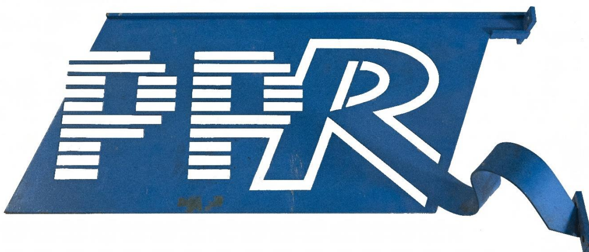
Bovenstaande foto: Gevelbord PPR