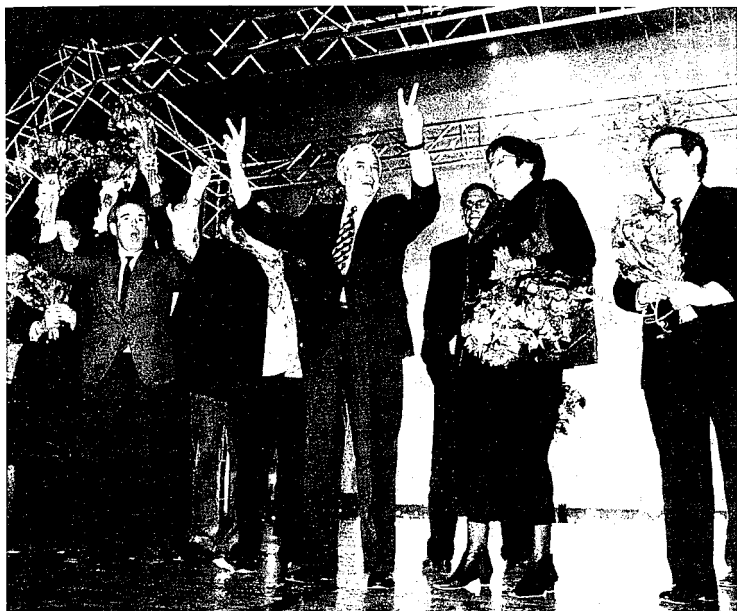
Frits Bolkestein gekozen tot lijsttrekker voor de verkiezingen van 1994, geflankeerd door Frans Weisglas, Annemarie Jorritsma en Dick Dees. Hans Dijkstal is de man op de achtergrond.

het inderdaad mogelijk is. Hierop stuurt de majesteit van elke partij een zwaargewicht het veld in om met de drie fractieleiders verder af te tasten of een regeerprogramma een haalbare zaak is. Voor Bolkestein had dit niet hoeven, omdat het tot extra veel gepraat zou leiden. Klaas de Vries (PvdA), Gijs van Aardenne en Jan Vis (D66) zijn zes weken bezig, maar komen er niet uit. Ze geven hun opdracht terug, omdat de vvd voor de jaren '95, '96 en '97 bijna zes miljard gulden extra wil snoeien in de sociale uitkeringen. Dat vinden PvdA en D66 te veel. Paars lijkt van de baan.