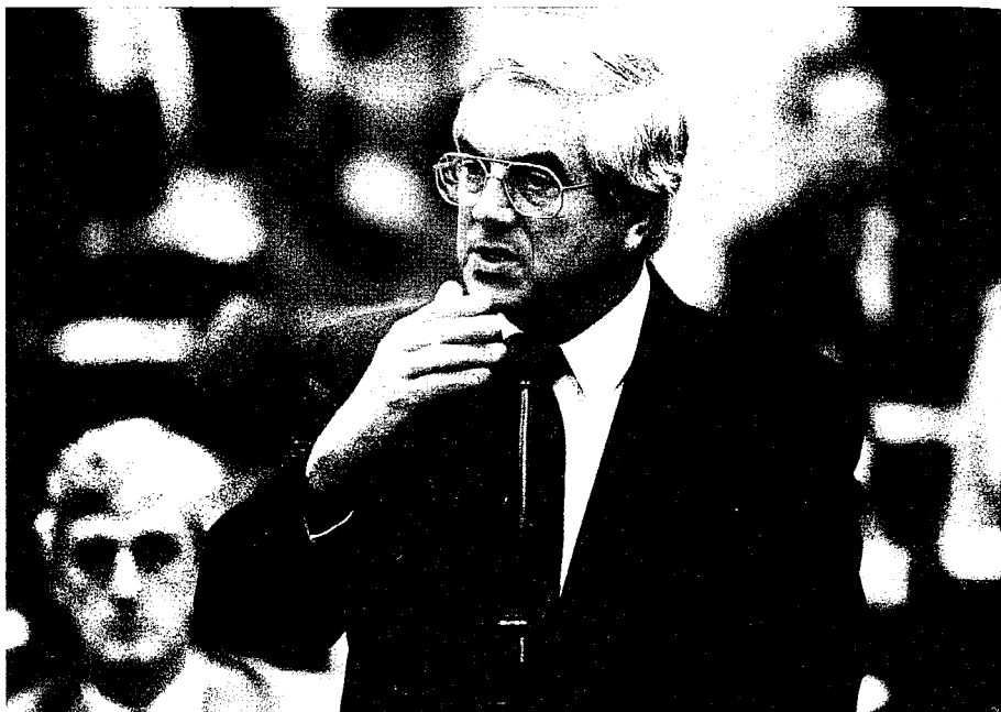
Frits Bolkestein tijdens zijn eerste algemene politieke beschouwingen op 11 oktober 1990.

den als de vvd-leider in 1999 naar Brussel vertrekt voor een zetel in de Europese Commissie. 'Mijn opvolger Hans Dijkstal is verweten dat hij het thema uit zijn handen heeft laten vallen.' Dat gebeurt ook min of meer bewust, waardoor aspirant-politicus Pim Fortuyn het onderwerp aan het begin van de nieuwe eeuw met succes naar zich toe trekt. De vvd gaat in 2002 onderuit. Na de moord op Fortuyn pakt Geert Wilders het maatschappelijk probleem bij de kop door zich te concentreren op de islam.