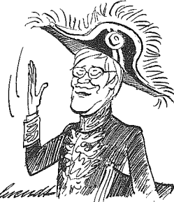
EN VAN PIEN.