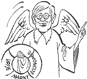
DE MIDDENSTANDERS ...