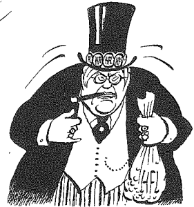
DE INDUSTRIEBOND N.V.V.