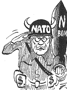
DE P.S.P. ...