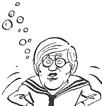
DE Pvd.A. ...