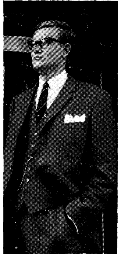
...wij jonge liberalen.....

Naast de nodige ernst heeft het aan humor in de JOVD gelukkig nooit ontbroken: men beluistert de JOVD-grammofoonplaat, men leze de Driemaster, men bezoekt onze congressen. De voorbereidingen van de congrescommissie zijn in