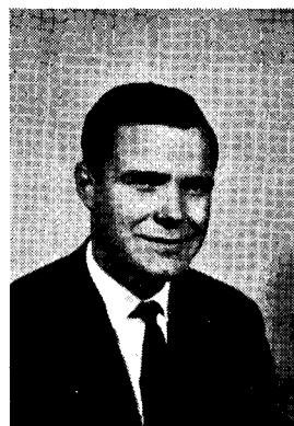
De nieuwe voorzitter

MAANDBLAD VAN DE ONAFHANKELIJKE LIBERALE JONGEREN ORGANISATIE VRIJHEID EN DEMOCRATIE