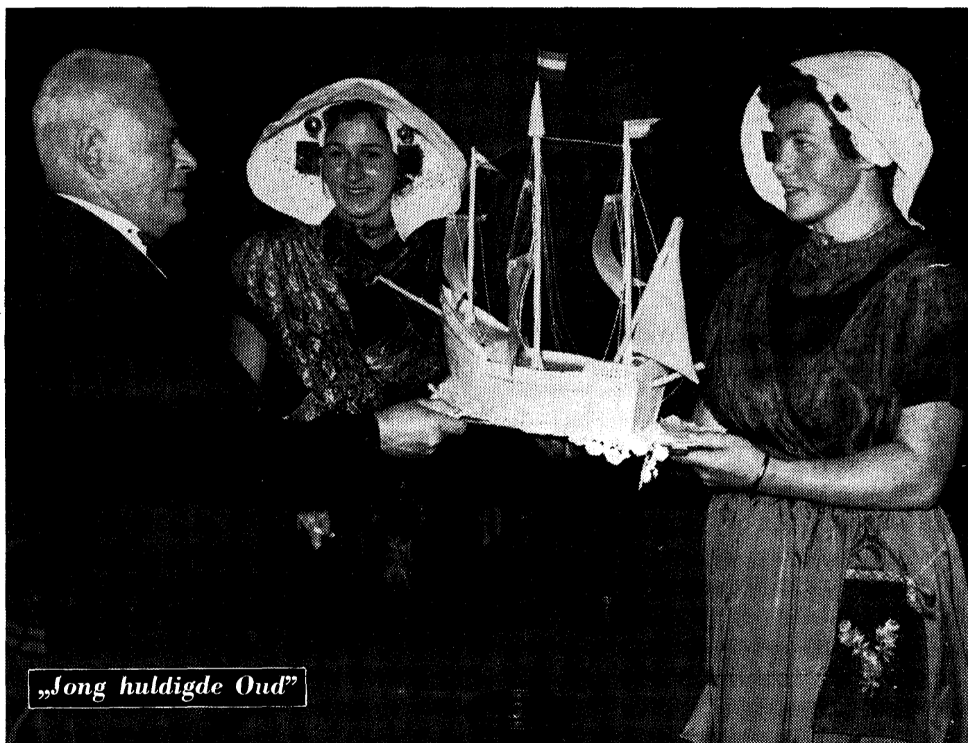
„Jong huldigde Oud”

aanvaardt het ere-voorzitterschap van de J.O.V.D.