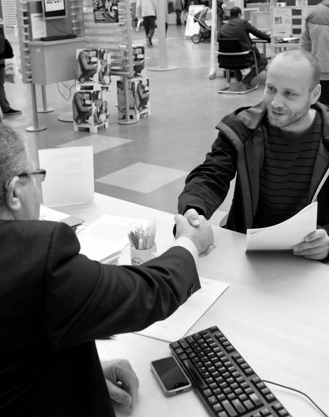
Rotterdam, 10 oktober 2013 – Een man zoekt werk via het UWV Leerwerkloket Werkplein.