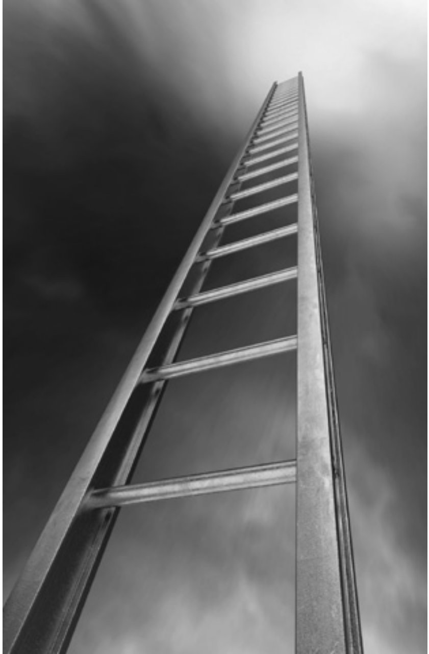
Corporate ladder