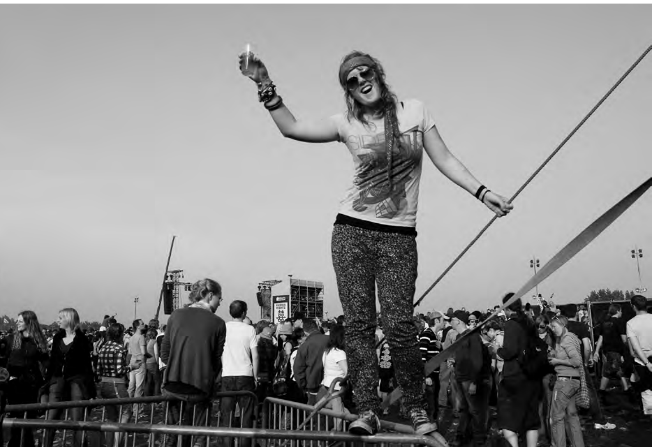
Pinkpop, Landgraaf 2008