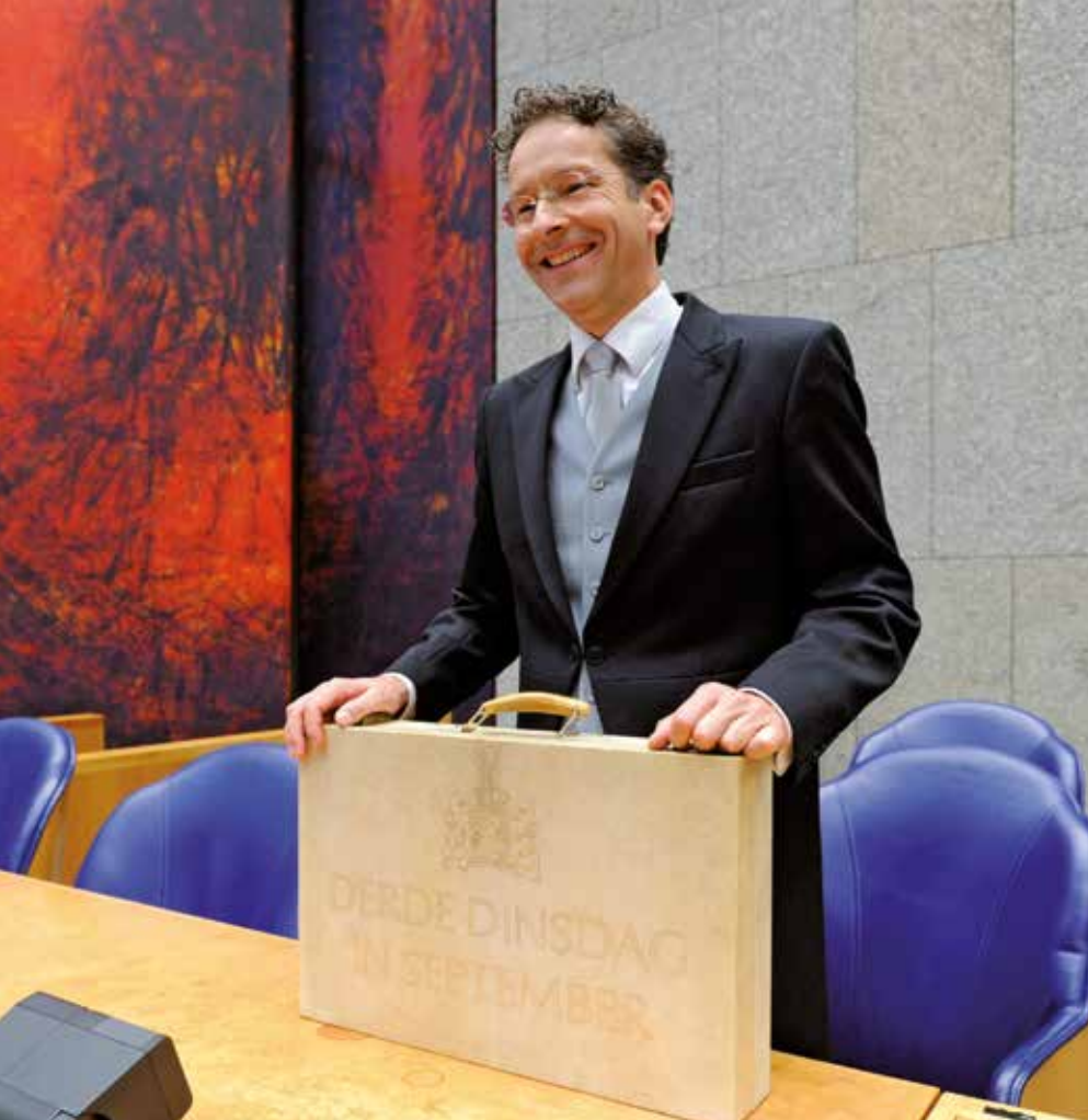
Een lachende minister Dijsselbloem tijdens Prinsjesdag 2014. Ten onrechte, want ook volgend jaar wordt er weer flink bezuinigd door het kabinet Rutte II.

beleggen en zouden kunnen twijfelen aan de kredietwaardigheid van Nederland. Daarbij hebben beleggers geen last van bezuinigingen op onderwijs en zorg.