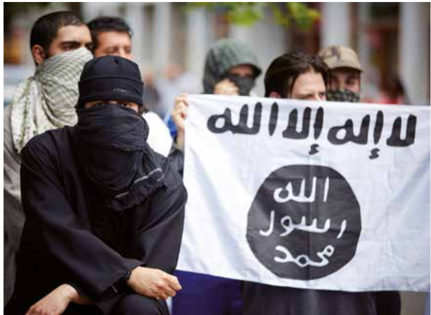
Radicaal islamitische jongeren betuigen steun aan ISIS tijdens een demonstratie in Den Haag op 24 juli.

Ook vallen in dit boek harde woorden over de slechte omgang met het milieu. 'De fossiele brandstoffen industrie, vernietigt ondertussen meedogenloos het ecosysteem voor de winst.' Hoe dat in olierijke moslimlanden gaat vertelt het boek niet. Wel dat de sharia economische stabiliteit brengt, evenals bescherming van privacy – zelfs vrijheid van godsdienst. En dat het rechten zal geven aan vrouwen (die eindelijk 'in harmonie' kunnen leven met hun man) en dieren (een vrouw komt in de hel als ze haar kat niet voldoende te eten geeft).