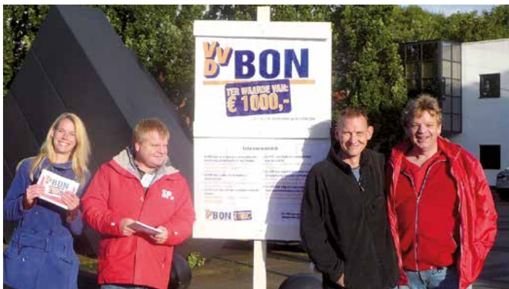
De VVD-bon-actie is bedacht tijdens een van de opdrachten van de Zomeruniversiteit 2013.

‘Sinds eind jaren tachtig zijn de bakens veranderd. Het idee leefde toen dat het Westen de Koude Oorlog had gewonnen. Het vrijemarktdenken werd dominant, waardoor het vrijhandelsverkeer een enorme boost kreeg. Landen werden gedwongen zich open te stellen als afzetgebieden. Door de vrijhandelssfeer kwamen de arbeidsrechten onder druk te staan. De arbeidsmarkt werd geflexibiliseerd, lonen gingen omlaag en – voor zover aanwezig – werd het ontslagrecht versoepeld. En ten behoeve van de concurrentiepositie wordt ons sociale zekerheidsstelsel langzamerhand om zeep geholpen. Voor ons als socialisten is het zaak om op deze processen vanuit onze ideologie fundamentele kritiek te leveren. Deze