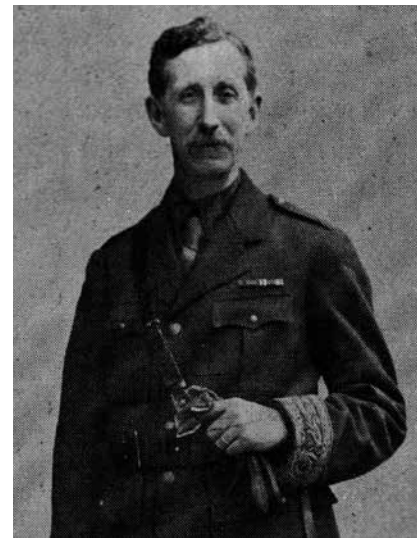
De Engelse officier Mark Sykes en zijn Franse collega Georges Picot, die in 1916 de basis legden voor de kaart van het Midden-Oosten.

roep van de politieke islam als antwoord op het mislukte nationalistisch project van de Arabische wereld. Geen enkele Arabische staat kon zich bevrijden van het westers kolonialisme. Ook de vestiging van de staat Israël werd als een westers koloniaal project gezien. De pogingen van Arabische pan-nationalisten als Nasser (Egypte), Assad (Syrië) en Hoessein (Irak) in de periode 1950 – 1990 liepen op niets uit. De Amerikaanse invasie in Irak in 1991 en zeker die in 2003 heeft het nationalistische Arabisch idee definitief vernietigd. De westerse samenwerking met autoritaire staten heeft er al die jaren niet onder geleden. Ten einde de invloed van Irans revolutie in te dammen richtten de Amerikanen (in 1983) het Centraal Commando op, CENTCOM, vestigden ze militaire bases in Jordanië, Saoedi-Arabië en gingen ze op tal van manieren nauwe politiek militaire samenwerking aan met Arabische dictaturen. 4 De Amerikaan-