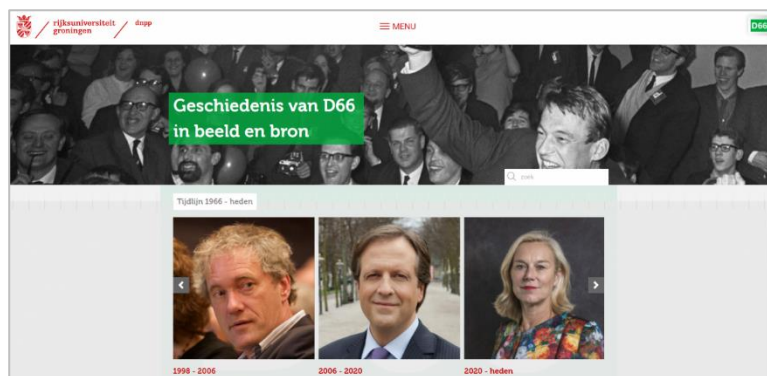
Website over de geschiedenis van D66.

Op 14 oktober ging de website over de geschiedenis van D66 online, de dag waarop D66 55 jaar geleden werd opgericht. Deze site, die is opgezet naar het voorbeeld van de door het DNPP ontwikkelde geschiedenis-sites van de VVD en het CDA, brengt informatie over D66 bijeen aan de hand van speciaal voor deze site geschreven teksten, mede gebaseerd op enerzijds gedigitaliseerde bronnen (zoals beginsel- en verkiezingsprogramma's, affiches, statuten en reglementen, artikelen uit ledenbladen en het wetenschappelijk tijdschrift) en anderzijds – als verdieping – gedigitaliseerde publicaties over D66 van DNPP-medewerkers en andere auteurs. Teksten, bronnen en literatuur zijn door links met elkaar verbonden en vormen daardoor een geïntegreerd geheel. De geschiedenis van D66 is ingedeeld in zeven periodes, waarin telkens naast een algemeen historisch overzicht zes thema's aan bod komen (geschiedenis, programmatische ontwikkeling, verkiezings- en – eventueel – regeringsdeelname, organisatorische evolutie, Europa en partijleiders). In dit project werd samengewerkt met de VMS, het wetenschappelijk bureau van D66.