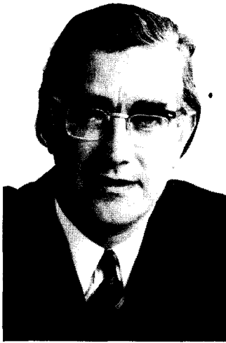
PORTRET VAN EEN PARTIJGANGER

DE DEMOCRAAT IN GESPREK MET AAR DE GOEDE