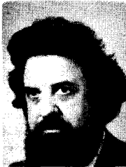
door Arie A. Manten.

Tot de slechtste verkiezingen die D'66 heeft meegemaakt behoren de statenverkiezingen van 1974. Vier statenleden was alles wat we toen overhielden: twee in Utrecht (in een gemeenschappelijke progressieve fractie) en één in zowel Noord- als Zuid-Holland (zelfstandige fracties). De droefheid werd nog vergroot doordat in 1974 de ene helft van de Eerste Kamer aftrad, en in 1977 de andere helft: twee verkiezingen dus net binnen deze ene statenperiode. Dat kwam de partij te staan op het verlies van alle zetels die zij in de Eerste Kamer had.