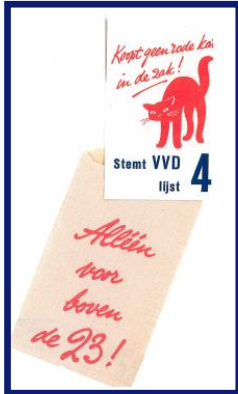
Suikerzakje, gebruikt campagnemateriaal Tweede Kamerverkiezingen 1959