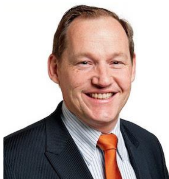
Jock Geselschap Internationaal Secretaris