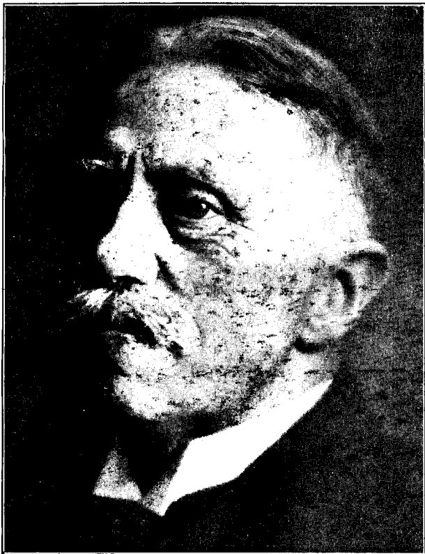
De nieuw opgetreden Voorzitter der Christelijk-Historische Unie Jhr. Mr. D. J. de Geer.