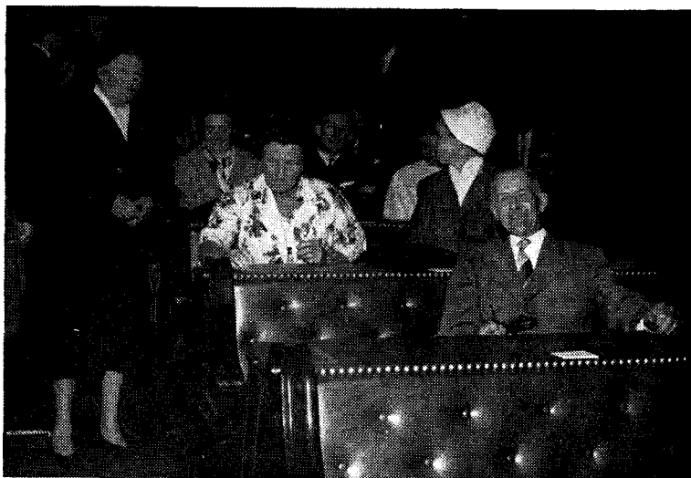
Enkele gasten van het Centraal Comité op Prinsjesdag 1962 in de banken van de vergaderzaal van de Tweede Kamer.

Het is dienstig, dat het kiesverenigingsbestuur er bij het samenstellen van de gespreksgroep(en) in de vereniging de nadruk