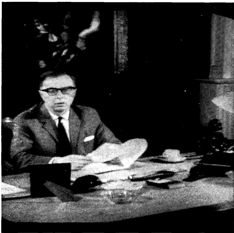
Z.E. prof. dr. J. Zijlstra tijdens de eerste A.R. televisie-uitzending.

Een partij die niet huichelt als zij beweert een boodschap voor heel het volk te hebben, grijpt de kansen, die haar geboden worden om die boodschap bij zoveel mogelijk mensen ineens te brengen. In wezen hebben de A.R., het bovenstaande overwegende, geen seconde gearzeld dat hulpmiddel te aanvaarden.