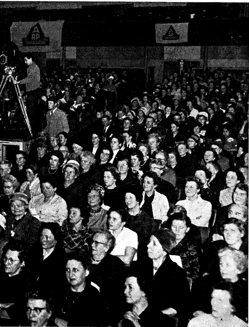
gadering op 22 maart 1962 in „Tivoli” te Utrecht.