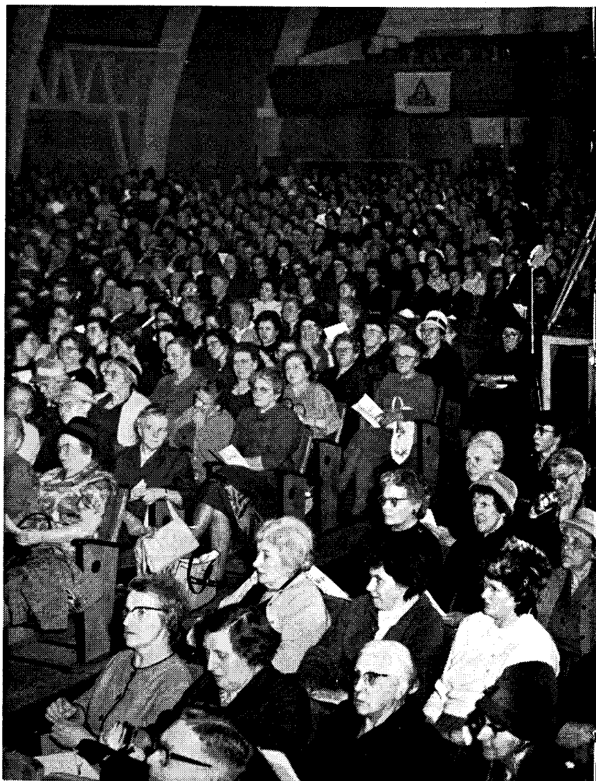
Een overzichtsfoto van de grote A.R. vrouwenvereniging