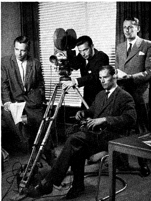
Tijdens de opname van een televisie-programma.

In een achttal uitzendingen waarvan één helaas kort na de start de „vernieling” inging (zoals dat in bepaald studio-jargon heet), heeft de partij getracht iets te laten zien van wat de A.R.P. is en beoogt. Het waren de eerste werkstukken, met al de kenmerken daarvan. Want het maken van een politieke uitzending waar de propaganda niet afdruipt (met averechts effect) en die ook geen „neutrale” documentatie is, dat is voor partijfunctionarissen én voor geharde T.V.-experts nieuw en soms zelfs vreemd werk.