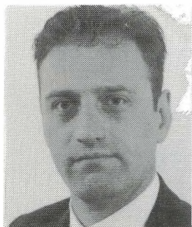
M. Randoe Ondernemer DORDRECHT