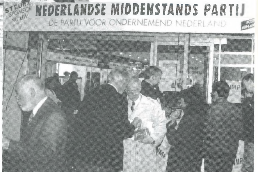
Drukte bij de N M P-stand tijdens de ondernemersbeurs in Boskoop.