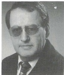
H. Hendrix Ondernemer TILBURG

Wij stellen u voor: de voorzitters van de regionale kiesdistrikten in ons land.