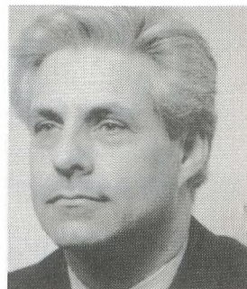
W. v. d. Sluis Ondernemer DEN BOSCH