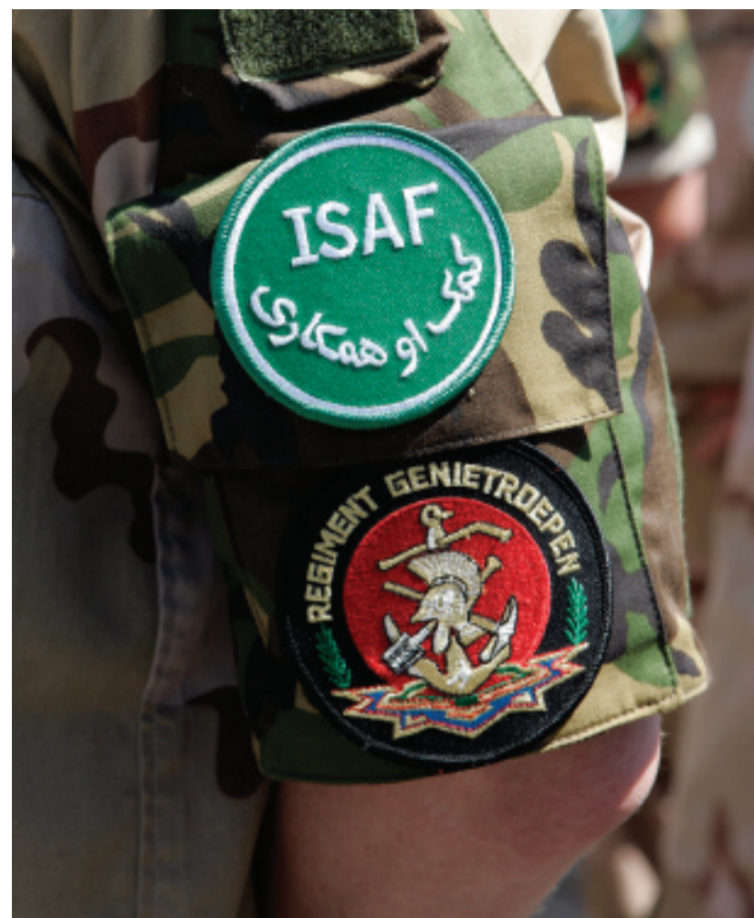
Internationale veiligheid: de capaciteit van de NAVO wordt verder aangepast aan de nieuwe behoeften voor operaties in crisisgebieden.