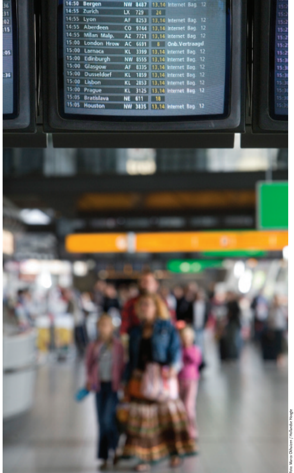
Terrorisbestrijding: we beseffen door 10 augustus (de vrijdelde aanslagen in Engeland) dat de dreiging allerminst voorbij is. Europese samenwerking in de aanpak van terrorisme is noodzakelijk.