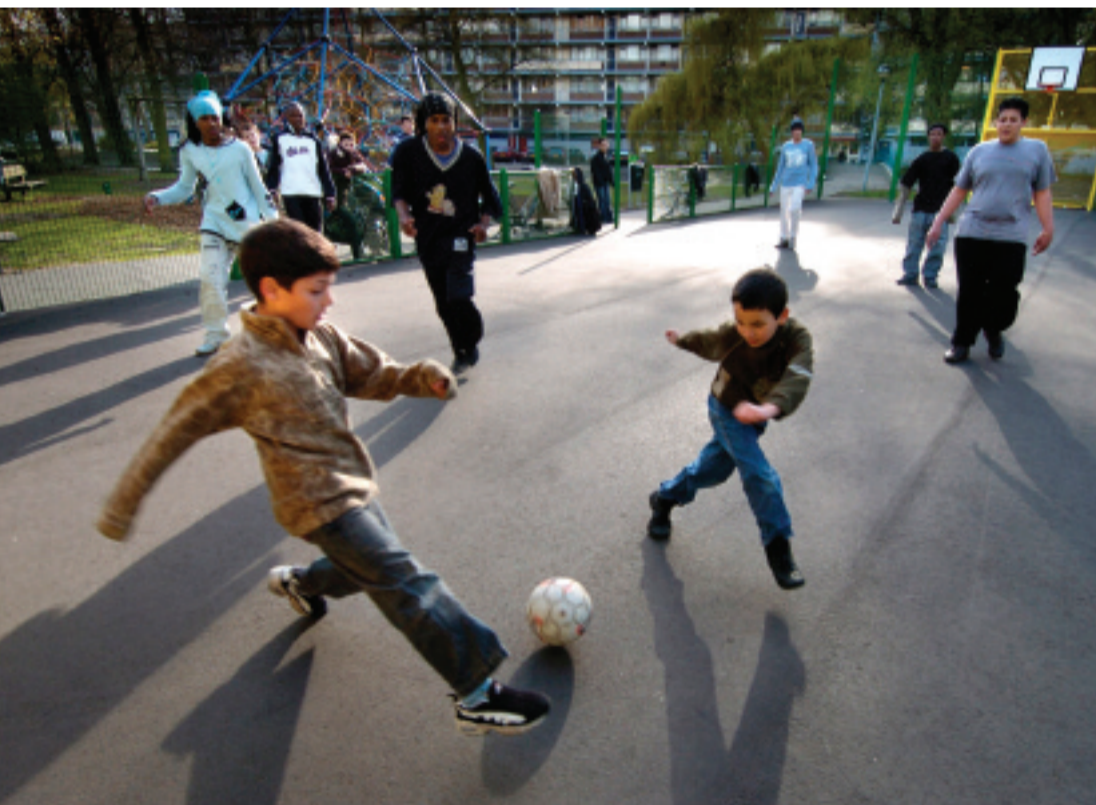
Stimulans voor sporten: voldoende ruimte in wijken voor de jeugd om te sporten.

zo leuk als was gedacht? Kan ik het eigenlijk wel? Deze vragen zijn alleen te beantwoorden als mensen, jong en oud, kunnen proeven aan de sport. Als ze worden gestimuleerd om te gaan sporten.