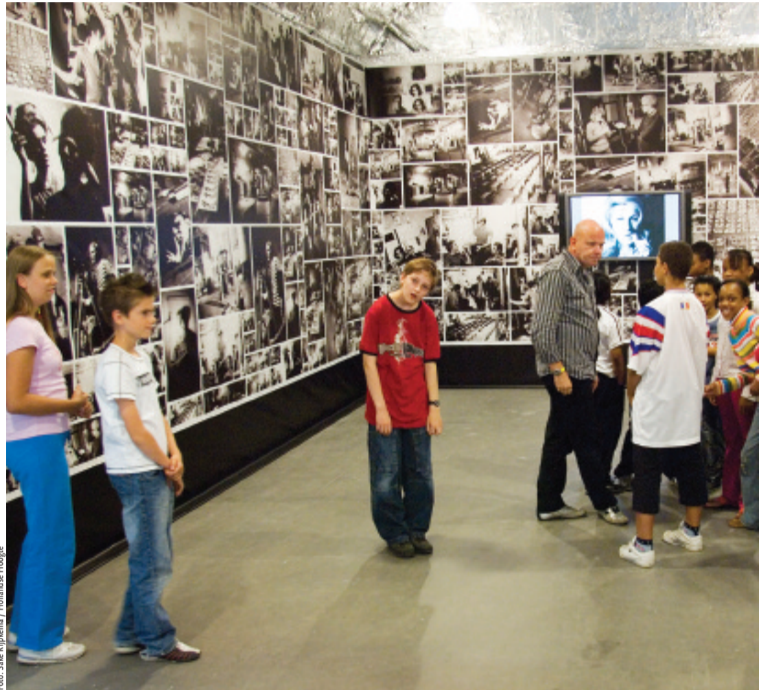
Kunst voor kinderen: het is belangrijk dat alle jongeren al vroeg in aanraking komen met kunst en cultuur.