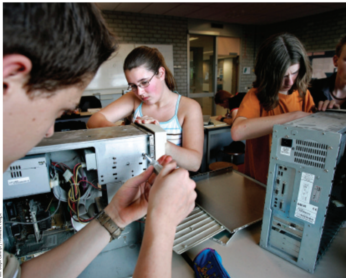
Onderwijs op het VMBO: de uitval in het VMBO moet drastisch omlaag. Met onderwijs gericht op kennis en kunde in veilige, schone en kleinere scholen.