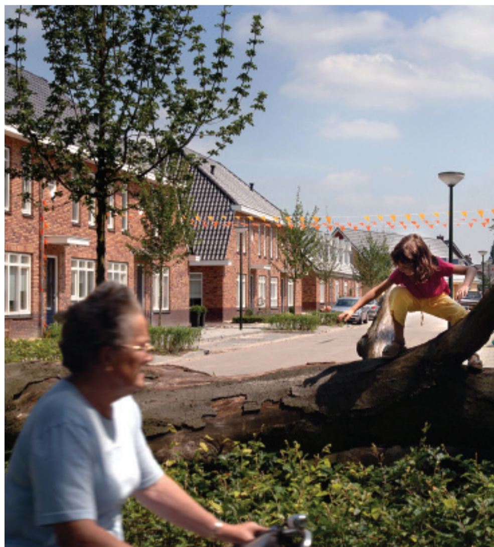
Aanpak woningnood: de komende jaren moeten 80.000 tot 100.000 nieuwe woningen per jaar worden gebouwd.

turering van woonwijken moet zich ook hierop richten.