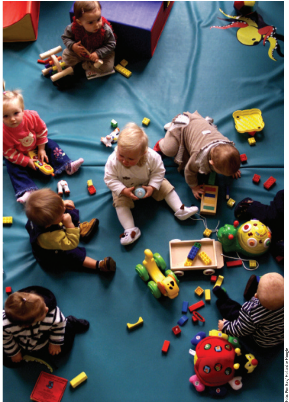
Kinderen eerst! Drie dagen per week gratis en kwalitatief goede kinderopvang voor iedereen.

ling van kinderen is het belangrijk dat ouders betrokken zijn en goed Nederlands spreken en schrijven. Daarom wordt aangehaakt bij inburgering en opvoedingsondersteuning, daar horen taallessen en alfabetiseringstrajecten voor ouders bij.