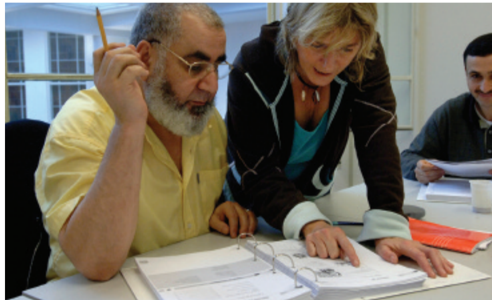
Integratie: meer dan werk en inkomen alleen. We verlangen dat iedereen Nederlands spreekt, maar zorgen er ook voor dat iedereen Nederlands kan leren.

Alle nieuwkomers in Nederland verdienen een kans om te integreren en volwaardig te participeren in de Nederlandse maatschappij. Bij de integratie van migranten is een grote inspanning van de migrant en de inzet van alle burgers, instanties en bedrijven vereist. De afgelopen jaren is de polarisatie en discriminatie toegenomen, waardoor soms zelfs goed geïntegreerde nieuwkomers zich van de Nederlandse samenleving hebben afgekeerd. We kunnen ons er niet bij neerleggen dat jongeren met Turkse of Marokkaanse ouders, die hier geboren en getogen zijn, westerse waarden zoals de democratie afwijzen. De problemen van vandaag die samenhangen met integratie zijn aanzienlijk en urgent. Integratie gaat over meer dan het overbruggen van sociaal-economische verschillen en taalproblemen: het heeft ook een culturele dimensie. Overigens hoort de Islam gewoon bij onze samenleving. Burgers kunnen met meerdere samenlevingen een binding hebben, zonder dat dit volwaardige deelname aan de Nederlandse samenleving in de weg hoeft te staan. Succesvolle integratie wordt niet bepaald door het hebben van één paspoort. Khalid Boularouz, de voorstopper van het Nederlandse elftal, is hiervan een treffend voorbeeld.