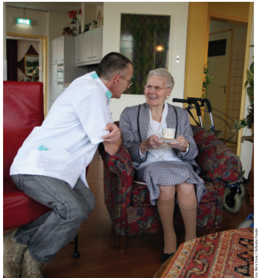
Verzorging verzekerd: er komt een noodplan voor de verpleeghuiszorg. We zorgen dat het personeel weer tijd heeft voor mensen.

Het is aan de zorgverzekeraars om dat uit te voeren.