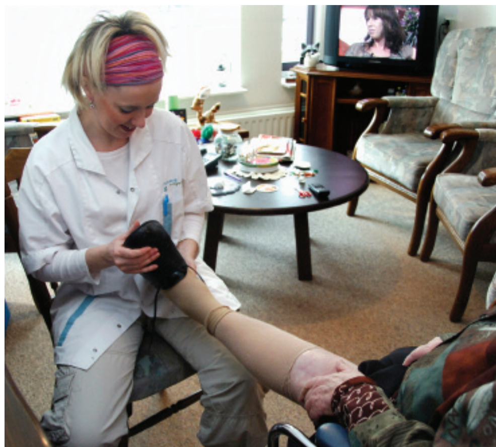
Verzorging verzekerd: het plafond op de zorguitgaven mag niet leiden tot wachtlijsten bij de thuiszorg of niet tijdig uitvoeren van andere geïndiceerde zorg.