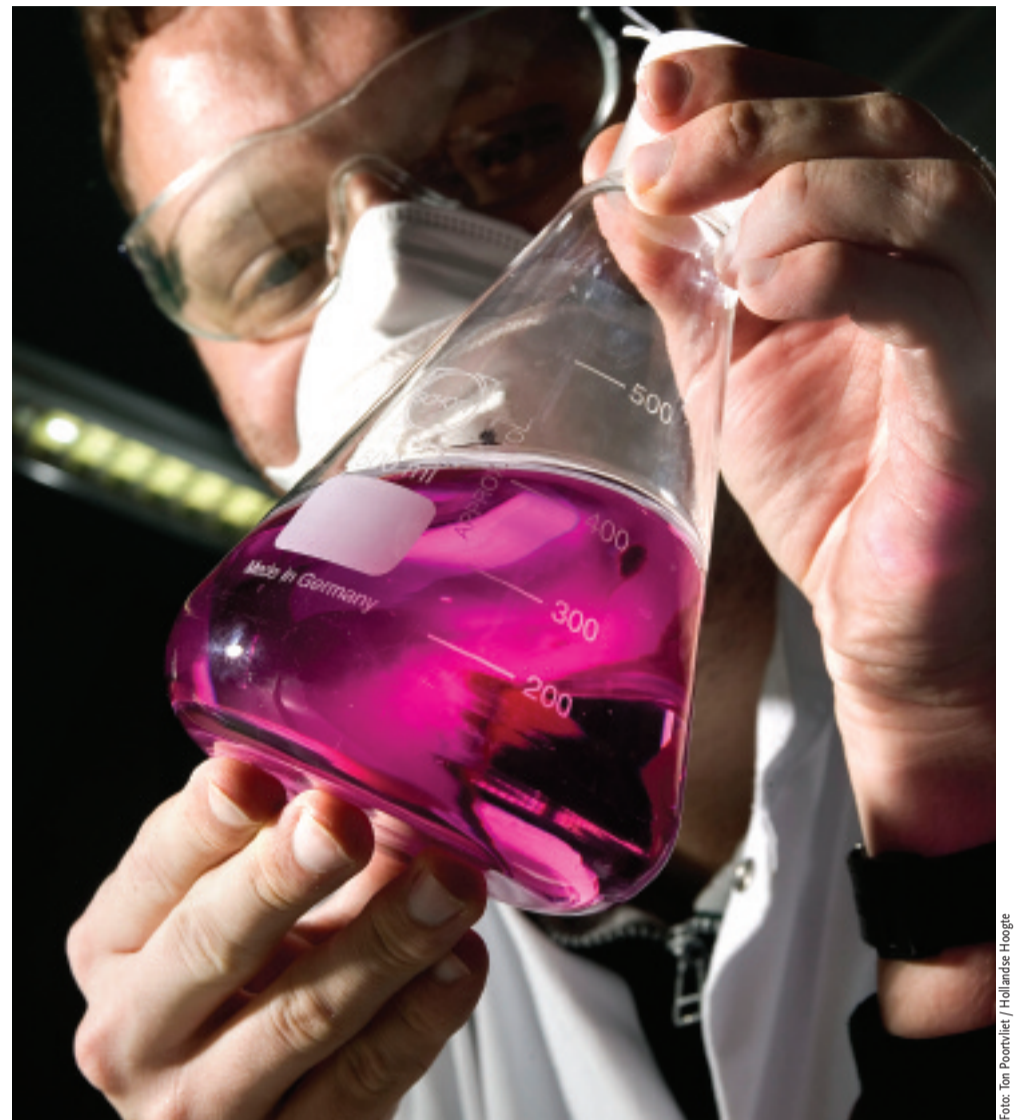
Investeren in innovatie: een sterk Nederland van morgen betekent vandaag investeren in kennis, kunde en innovatie.