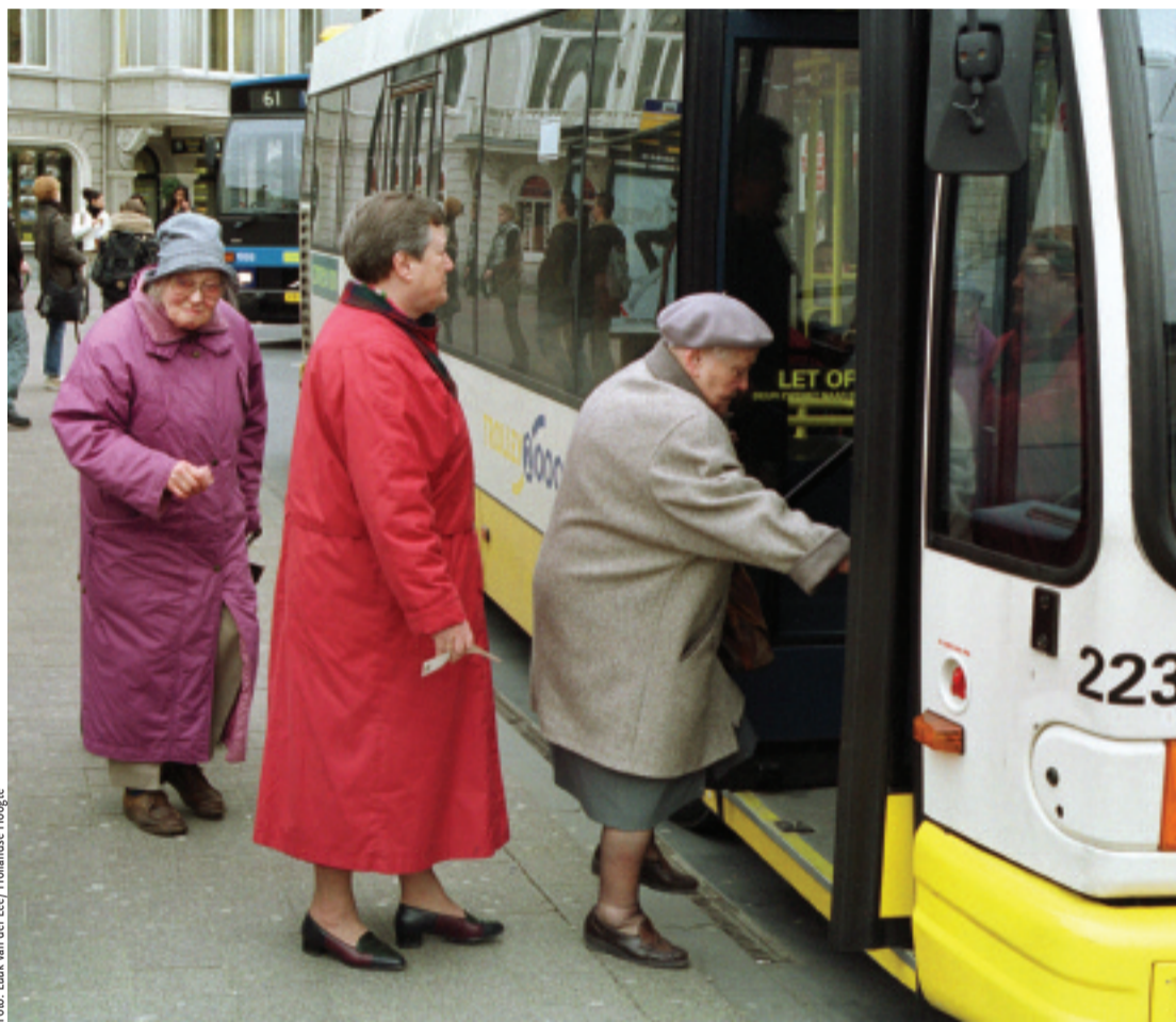
Openbaar vervoer: er komt gratis openbaar vervoer voor alle 65-plussers en gehandicapten in de daluren.