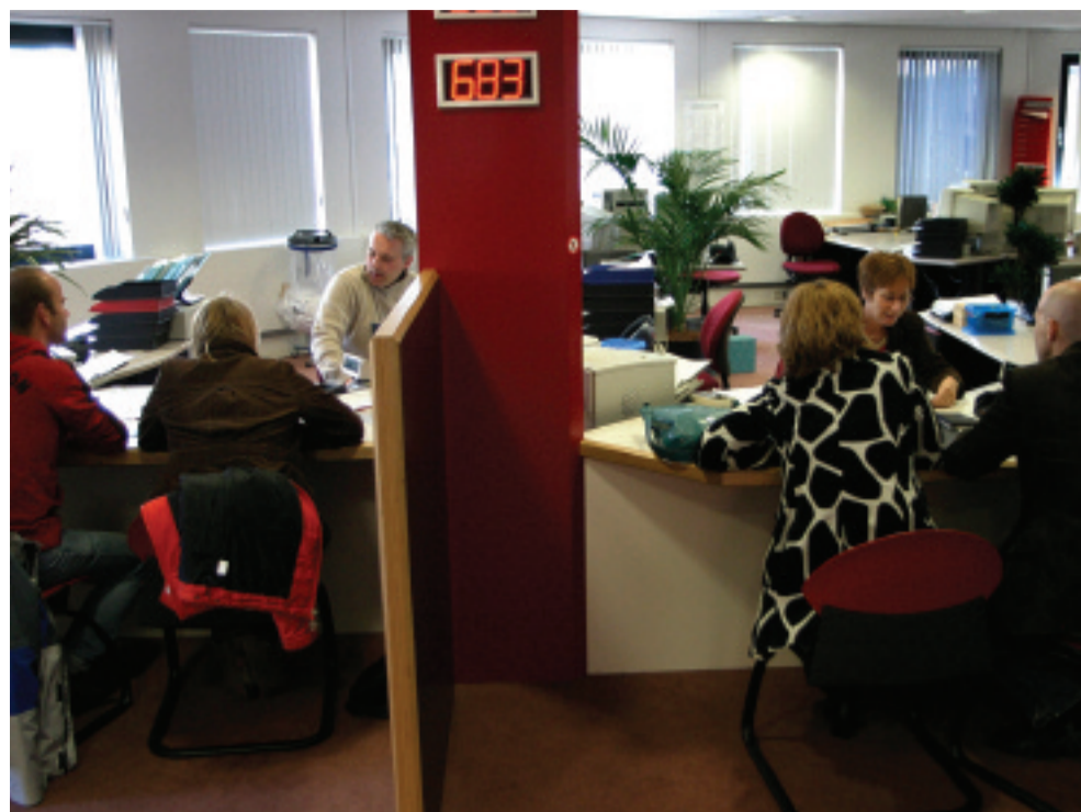
Kwaliteit in dienstverlening: de basis voor een goede dienstverlening is persoonlijk contact.