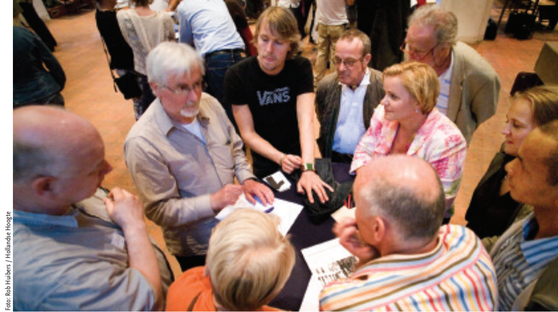
Politici van de PvdA baseren zich niet alleen op beleidsnota's, maar weten wat er in de samenleving speelt.