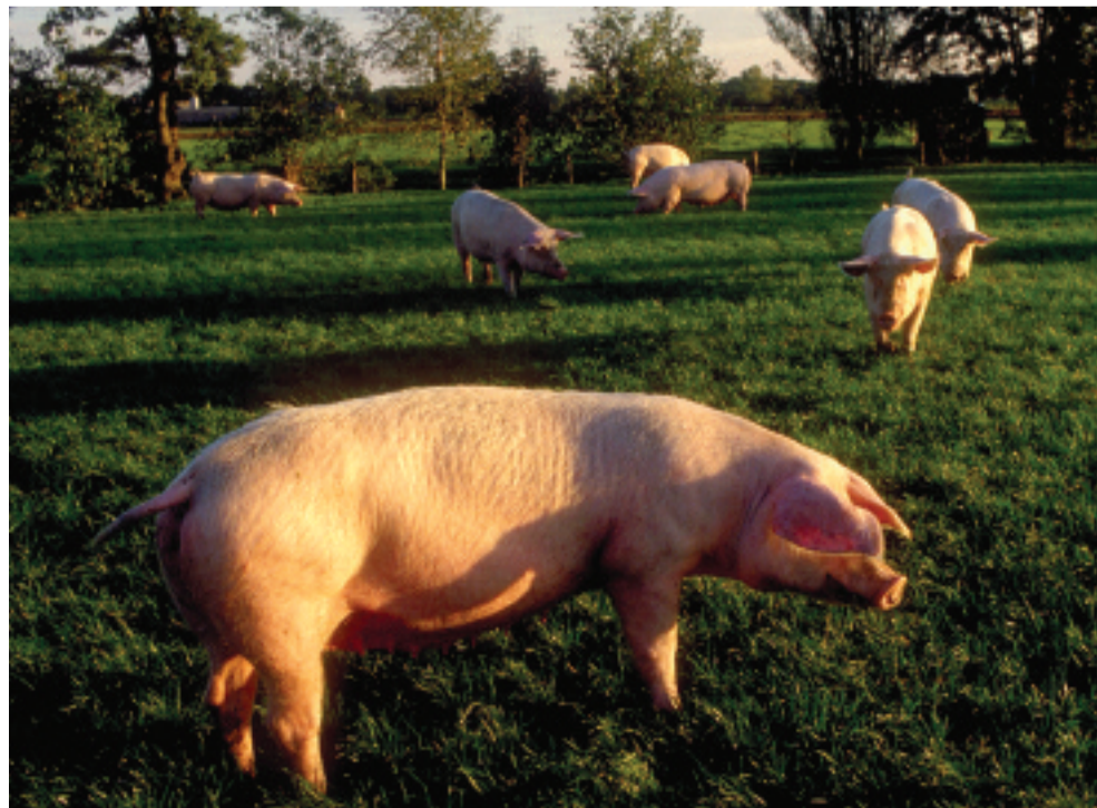
Dierenwelzijn: de veehouderij wordt diervriendelijker.