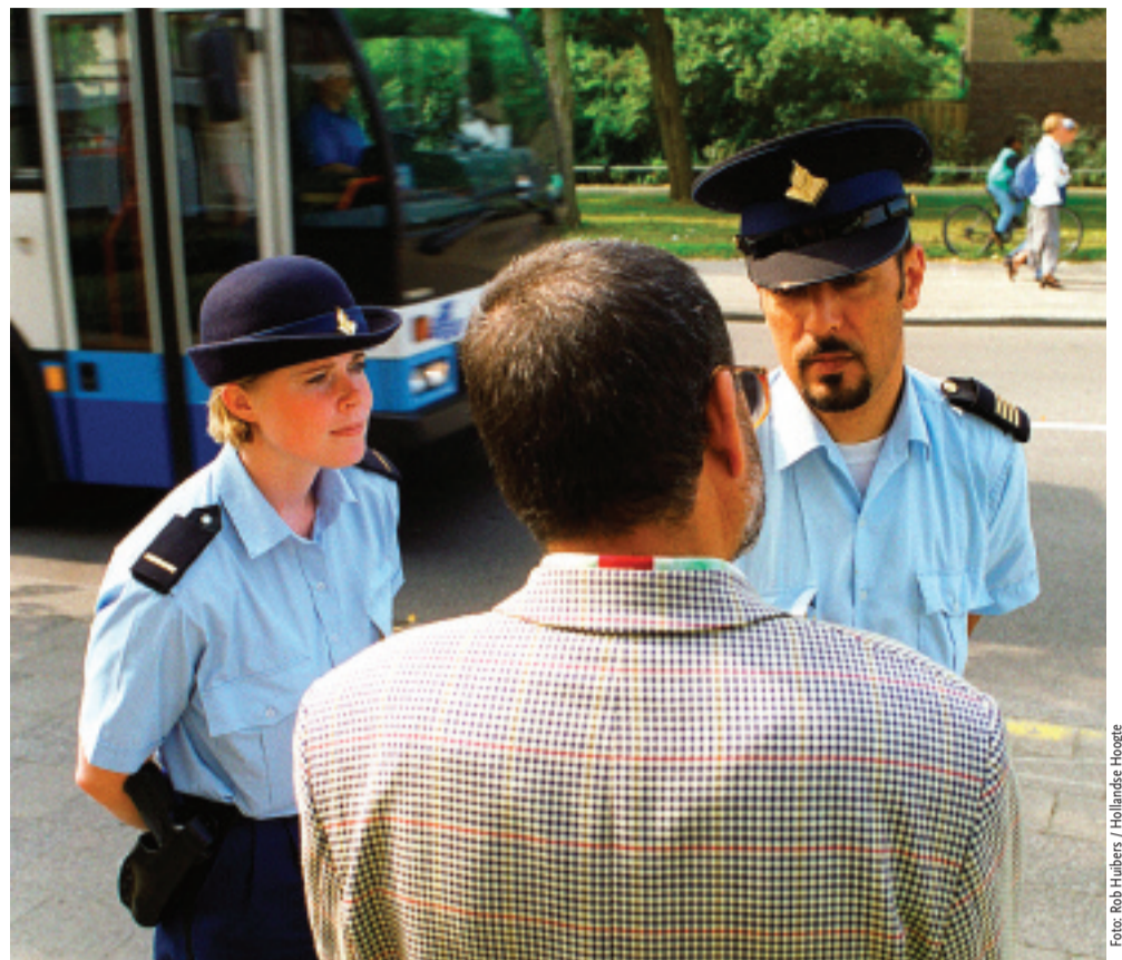
Veiligheid: een wijkagent in iedere buurt onderhoudt contact met bewoners en de middenstand.

aangesproken worden. Maar tijdige seksuele voorlichting op scholen kan ook helpen.