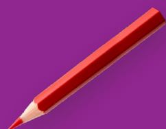
Bestuurlijke vernieuwing en directe democratie