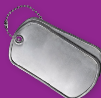
Defensie & Internationale Veiligheid