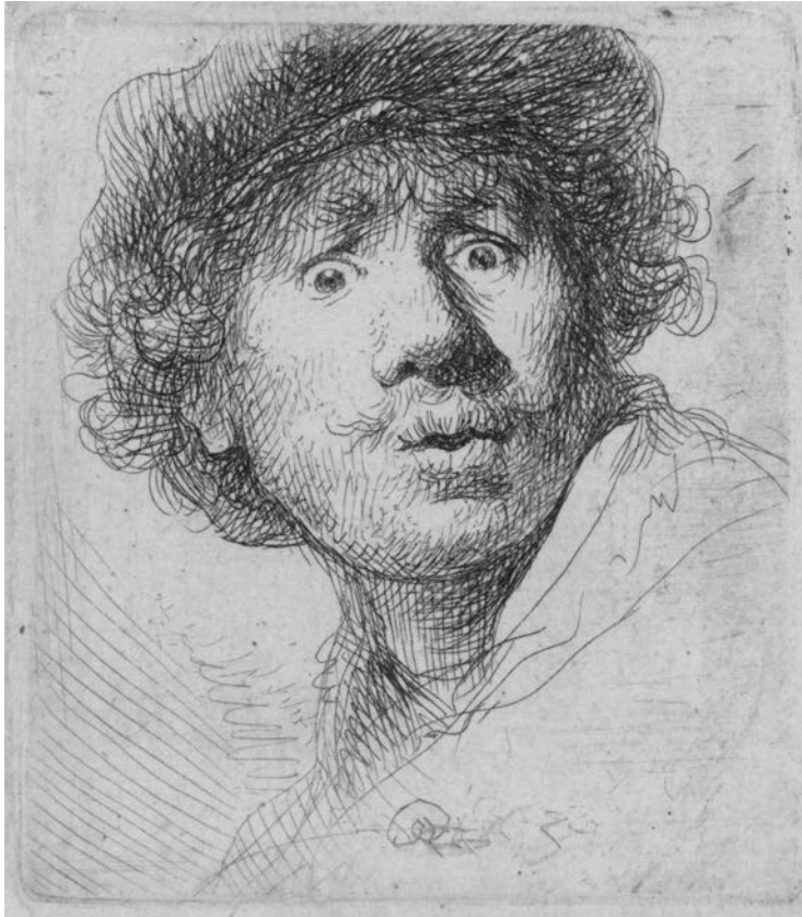
Figuur 1. Rembrandt Harmensz. van Rijn. Zelfportret met baret en opengesperde ogen (1630).