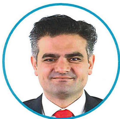
Tunahan Kuzu – Politiek Leider DENK