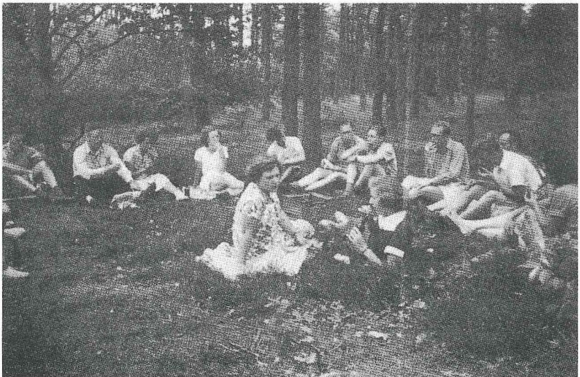
Tijdens het zomerkamp van 1951 in Holten vindt een picknick plaats.