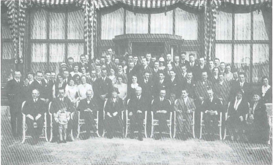
Een bijeenkomst van de Bond van Jonge Liberalen in 1933 in Den Haag