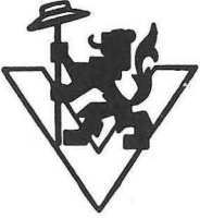
Het embleem van de JOVD