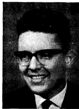
door F. WAGENMAKER

Het ligt voor de hand, dat wij aan een gematigd progressieve partij, die werkelijk bereid is om bestaande maatschappelijke en culturele vormen en verhoudingen te vervangen door betere, de voorkeur geven. Wij menen, dat liberale beginselen in een dergelijke partij goed tot hun recht kunnen komen. Liberalen streven niet naar radicale omwentelingen, maar naar doeleinden die bepaald worden door het toetsen van de maatschappelijke ontwikkeling aan de liberale beginselen. Het is daarom zaak, dat die beginselen een duidelijk licht werpen op de toekomstvisie van het liberalisme en dat een liberale beweging weet, waar zij op langere termijn naar streeft.